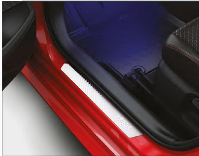
סט קישוטי סף קדמיים מקוריים היוצרים רושם מידי של סטייל, ובמקביל מגנים על סף הדלת מפני לכלוך ושריטות