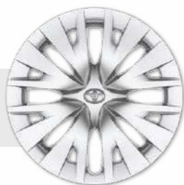
חישוקי פלדה 15"

*מומלץ לבדוק את תאימות הטלפון הנייד שברשותך למערכת ה-Bluetooth המותקנת ב-YARIS, אשר הינה מסוג: Toyota Touch 2. את הבדיקה ניתן לעשות בלינק הבא: www.toyota-tech.eu/bluetooth/search.aspx **נכון למועד פרסום קטלוג זה, אפליקציית Android Auto אינה זמינה בישראל. ***פעילות ה-E-call תלויה ברשת הסלולרית הנמצאת בקרבת הרכב בעת שידור המידע.