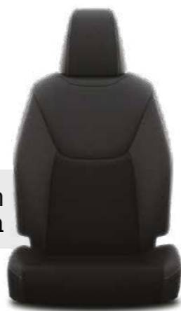
ריפודי בד בצבע שחור