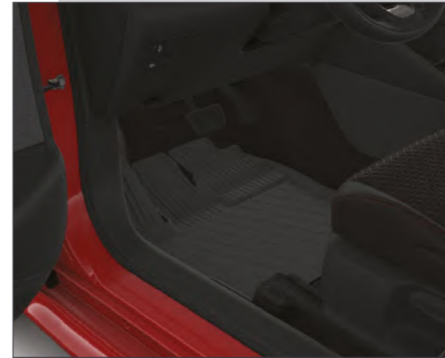
שטיחי גומי המגנים על פנים הרכב מפני לכלוך וניתנים להסרה ולניקוי פשוט