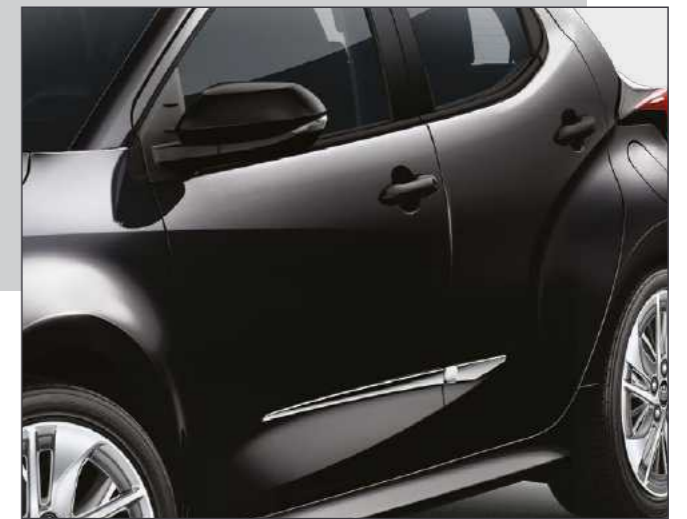
סט פסי קישוט בצבע כרום שישפיקו ליאריס שלך מראה קלאסי בעל נגיעה אלגנטית