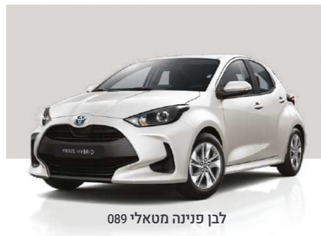
לבן פנינה מטאלי 089