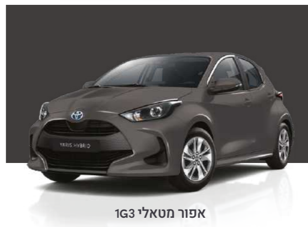
אפור מטאלי 1G3