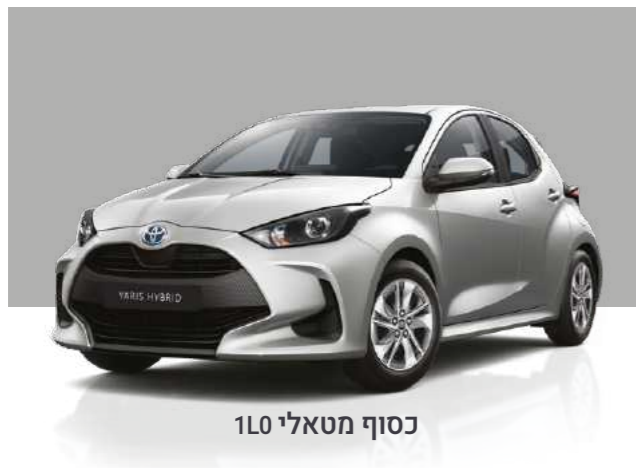
כסוף מטאלי 1L0