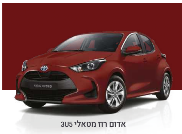
אדום רוז מטאלי 3U5