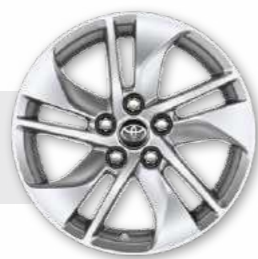
חישוקי סגסוגת קלה 15"