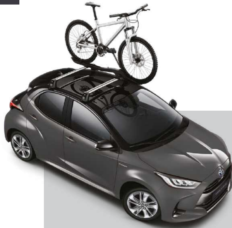
מוטות רוחב, עבור מגוון אביזרי גג ומתקני אופניים