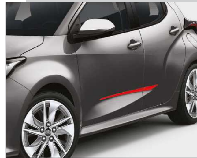
סט פסי קישוט בצבע אדום שיגרמו לראשים להסתובב בזכות נגיעת הצבע הנועזת שהם מוסיפים לרכב