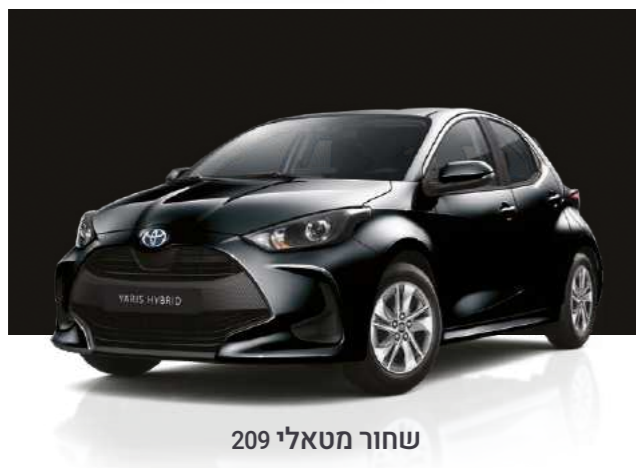
שחור מטאלי 209