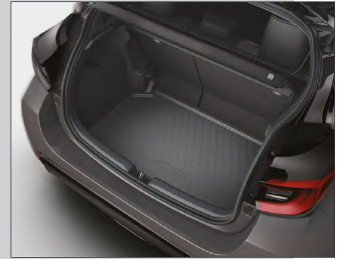
אמבטיה לתא המטען המספקת הגנה מפני לכלוך ומפני החלקה של ציוד וסחורה