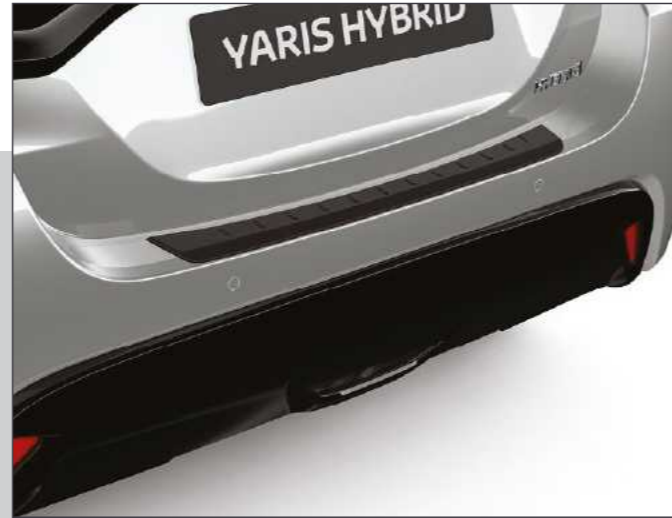
מגן פגוש אחורי המגן על הפגוש בעת טעינה ופריקה של סחורה מתא המטען