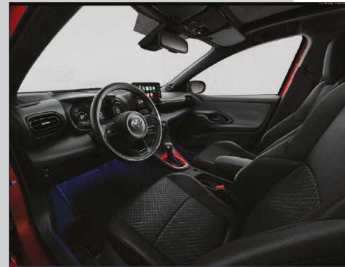
קישוט קונסולה מרכזית בצבע אדום שיהפוך את היאריס שלך לייחודית מבפנים כפי שהיא מבחוץ