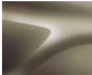
בז' מטאלי (HNP)

צבעים מטאליים תוספת בגין צבע מטאלי 1,200 ₪