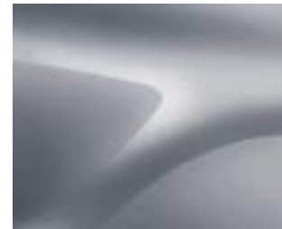
כסף מטאלי (KQA)