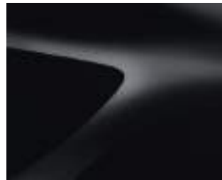
שחור פינה מטאלי (676)