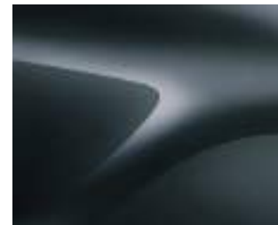
אפור מטאלי (KNA)