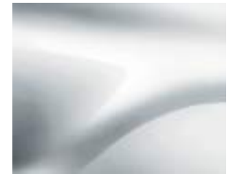
לבן קרח (369)