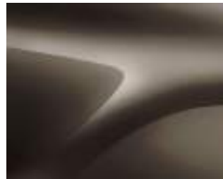
חום מטאלי (CNM)