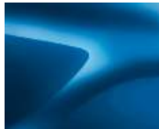
כחול בהיר מטאלי (RQH)