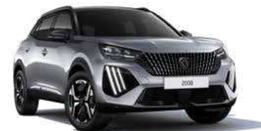
כסוף כהה מטאלי ARTENSE GREY