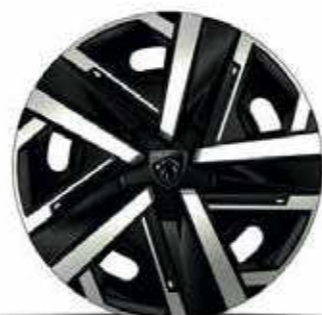
חישוקי סגסוגת 16" SILOM ACTIVE