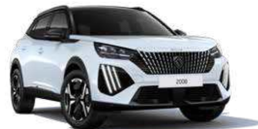
לבן מטאלי OKENITE WHITE