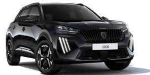
שחור מטאלי NERA BLACK