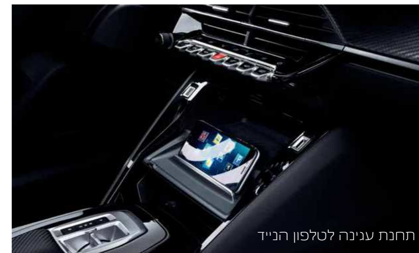
תחנת עגינה לטלפון הנייד

חברו את הטלפון הנייד שלכם בצורה אלחוטית (למכשירים תומכים בלבד), דרך APPLE CARPLAY™ או ANDROID AUTO ותוכלו לשלוט באפליקציות העיקריות שלכם, כגון: טלפון, ניווט, שיחות קוליות והודעות טקסט.