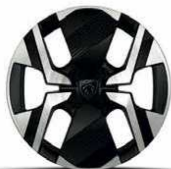
חישוקי סגסוגת 17" KARAKOY ALLURE