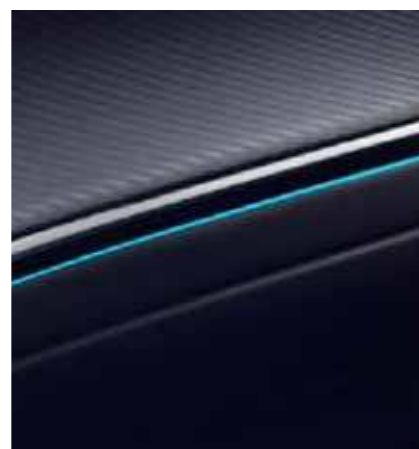
תאורת אווירה הניתנת להתאמה אישית