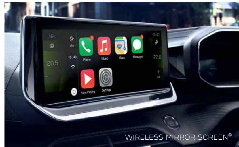
WIRELESS MIRROR SCREEN®