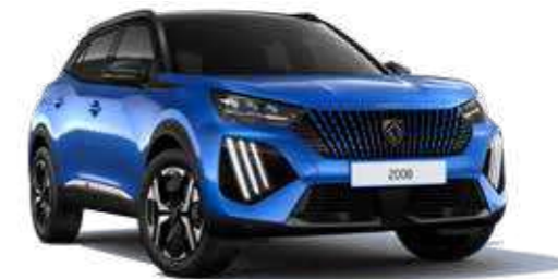
כחול פנינה מטאלי VERTIGO BLUE