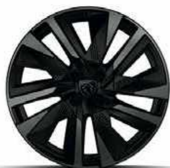
חישוקי סגסוגת 18" EVISSA GT