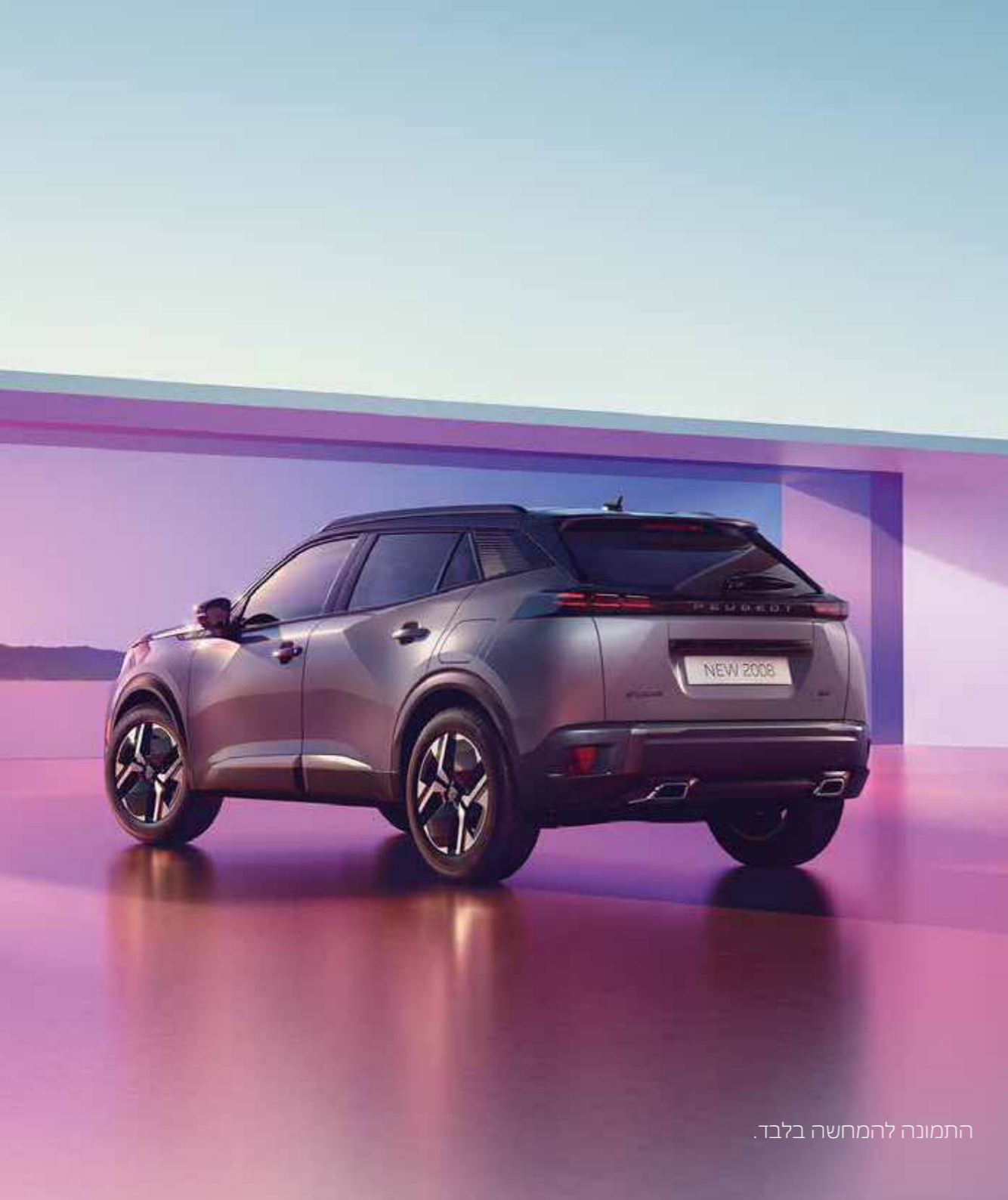
התמונה להמחשה בלבד.