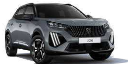
אפור כהה מטאלי SELENIUM GREY