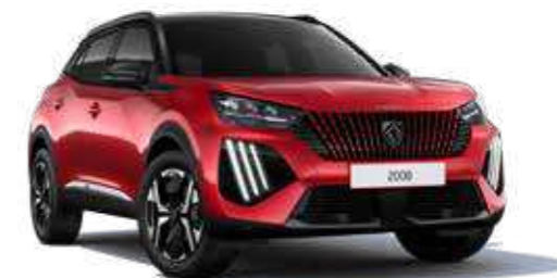
אדום מטאלי ELIXIR RED