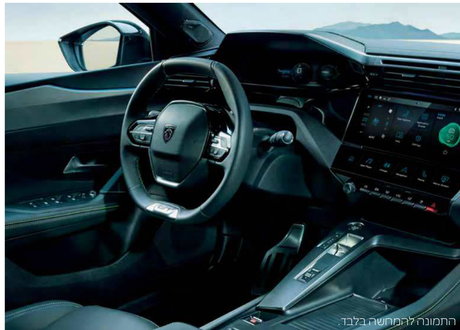
התמונה להמחשה בלבד.

ה- i-COCKPIT® של ה-408 מהווה חלק מה-DNA של פיג'ו. ה-408 מצויידת בהגה קומפקטי רב-תכליתי, לוח מחוונים שהיננו מסך בגודל 10 אינץ' הניתן להתאמה אישית ומסך מגע מרכזי בחדות גבוהה בגודל 10 אינץ'. תא הנוסעים מספק חווית נהיגה טכנולוגית ונוחה לשימוש.