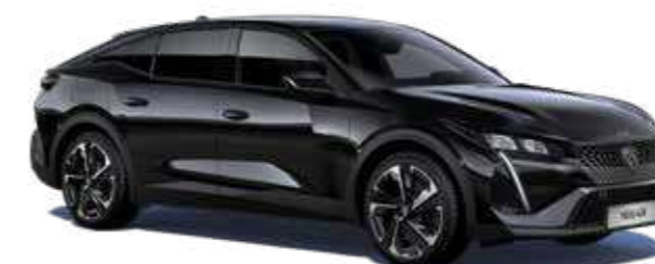
שחור מטאלי PERLA NERA BLACK