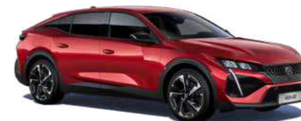
אדום מטאלי ELIXIR RED