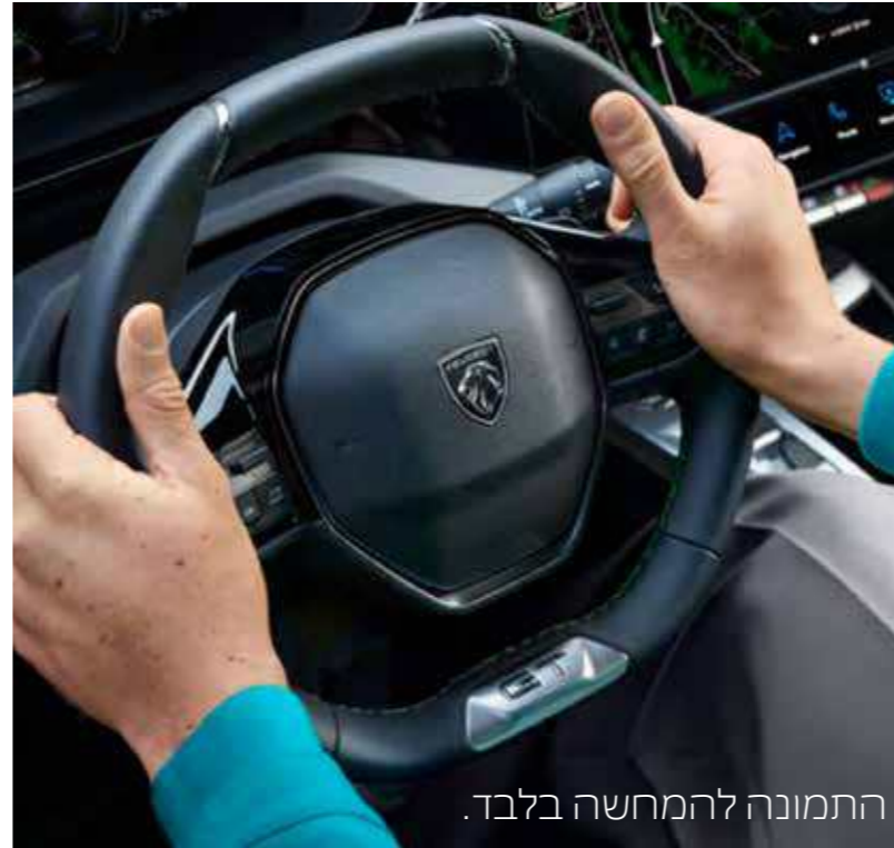
התמונה להמחשה בלבד.

בנוסף קיימת קישוריות™ ANDROID AUTO ו-APPLE CAR PLAY, גם באופן אלחוטי למכשירים תומכים.