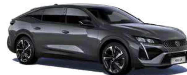
אפור כהה מטאלי TITANE GREY