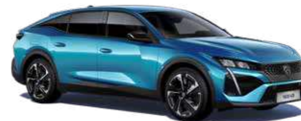
כחול בהיר מטאלי OBSESSION BLUE