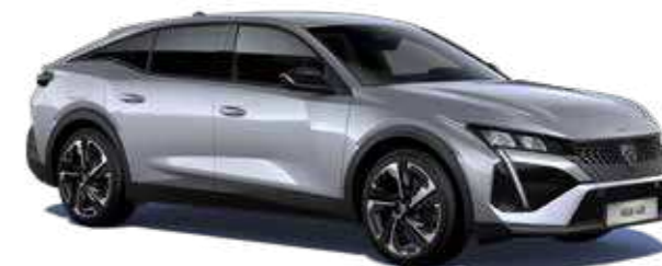
כסוף כהה מטאלי ARTENSE GREY