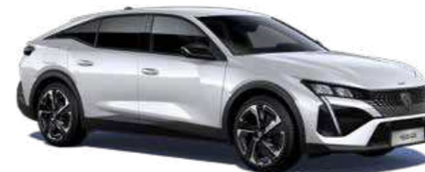
לבן פנינה מטאלי PEARLESCENT WHITE