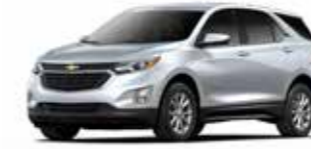
כסף מטאלי (GAN)