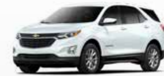
לבן פסגה (GAZ)