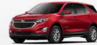
אדום קטיפה מטאלי (GPJ) *בתוספת תשלום