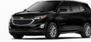
שחור מטאלי (G88)