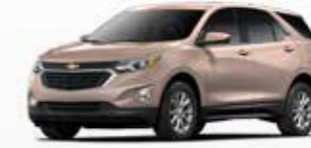
זהב סהרה מטאלי (G8K)