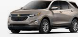
אפור ברונזה (GMU)