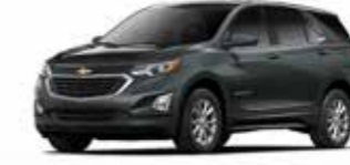
אפור כהה מטאלי (G7Q)