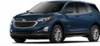
כחול כהה מטאלי (G35)