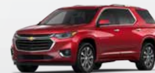
אדום קטיפה מטאלי (GPJ)**