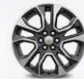
חישוקי "20 SLY" - רמת גימור Premier