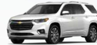
לבן פנינה (G1W)**