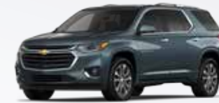
אפור כהה מטאלי (GPA)