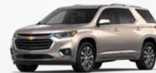
אפור ברונזה (GMU)