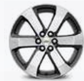
חישוקי "20 SP6" - רמת גימור LT AWD