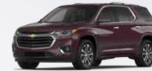
שחור בורדו מטאלי (GGA)