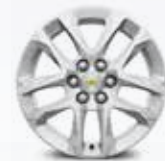
חישוקי "18 RT1" - רמת גימור LT FWD