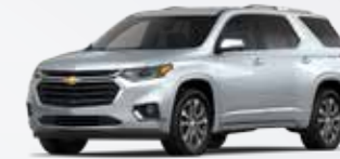
כסף מטאלי (GAN)