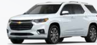
לבן פסגה (GAZ)