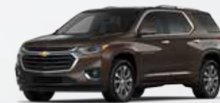
חום מטאלי (G2X)