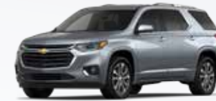
אפור פלדה מטאלי (G9K)