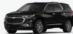
שחור מטאלי (G88)