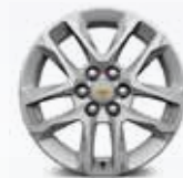
חישוקי "18 PXJ" - רמת גימור LS