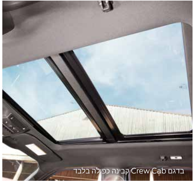
בדגם Crew Cab קבינה כפולה בלבד