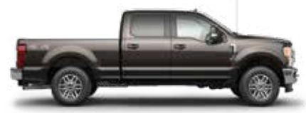
אפור אבן D1