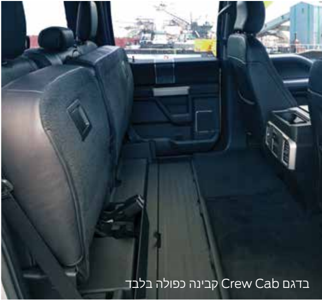
בדגם Crew Cab קבינה כפולה בלבד