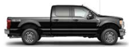
שחור אבן UM