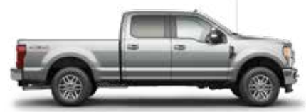
כסף מטאלי UX