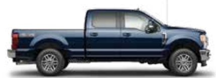
כחול ג'ינס N1