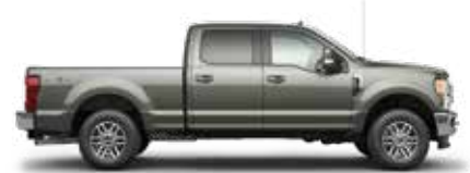
אפור שמפניה BN