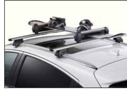
פסי רוחב לגגון