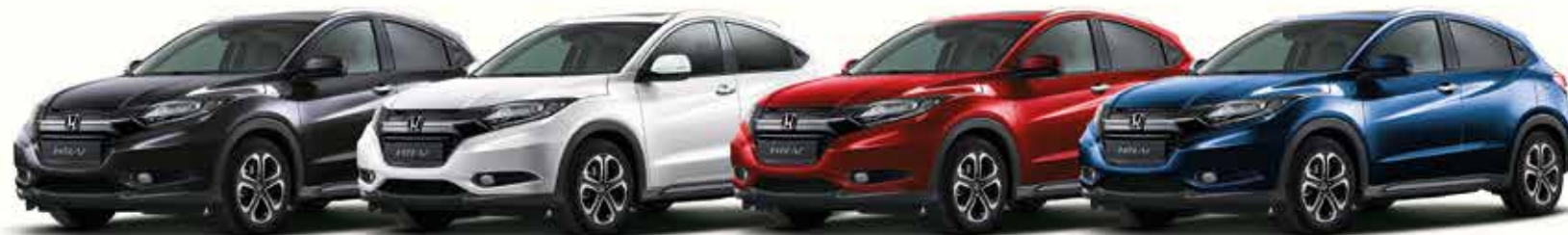
Ruse Black Metallic