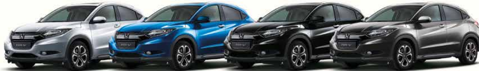
Alabaster Silver Metallic