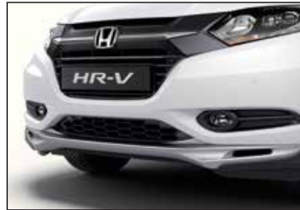
פנסי ערפל קדמיים