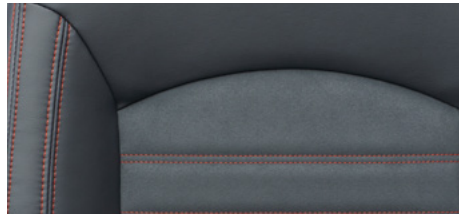
מושבי דמוי עור שחור בשילוב בד*