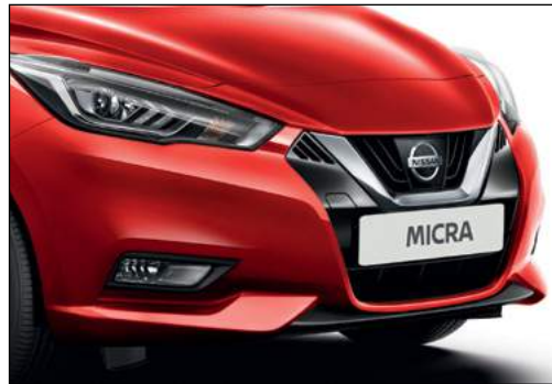
אדום שני מטאלי NBDK