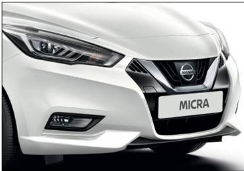
לבן פנינה מטאלי QNCK