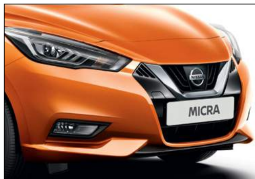
כתום ענבר מטאלי EBFK