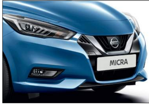
כחול אוקיינוס מטאלי RQ GK