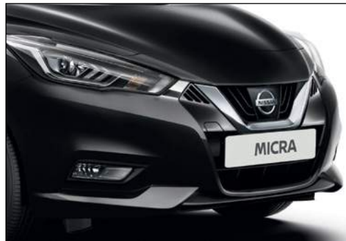
שחור מטאלי GNEK