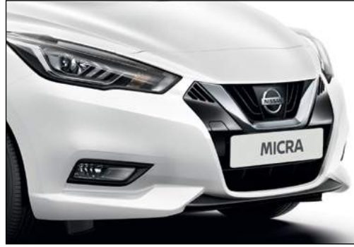
לבן צחור ZY2K