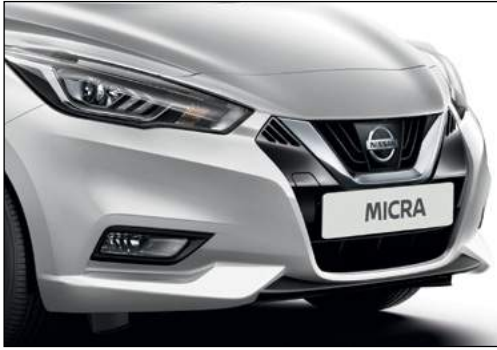
כסף מטאלי ZBDK