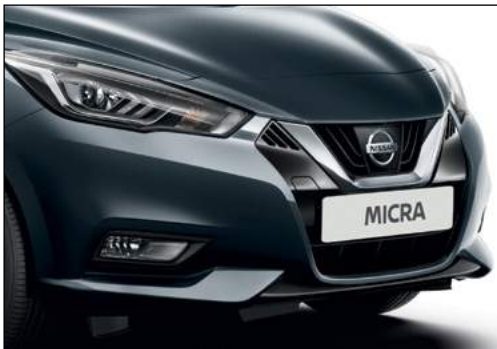
אפור כחול מטאלי KPNK