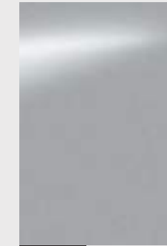
KLO כסף מטאלי