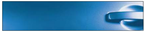
RCA כחול קריביים מטאלי