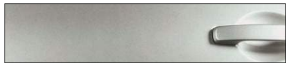
KYO כסף מטאלי