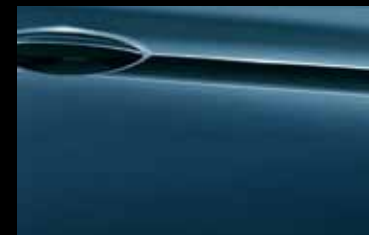
Deep Sky Blue