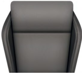
ריפוד מושבים מעור / אלקנטרה