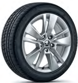
חישוקי סגסוגת 17"