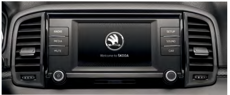
מערכת מולטימדיה מקורית בעלת מסך בגודל 6.5"