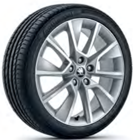
חישוקי סגסוגת 18"