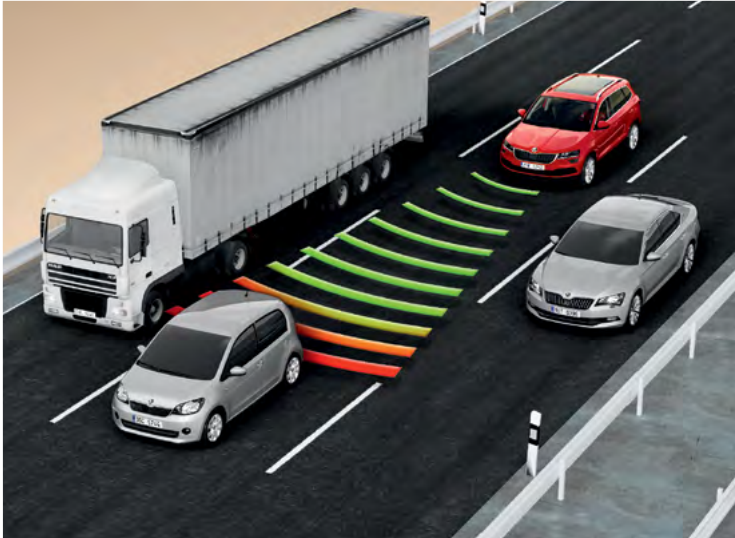
בקרת שיוט אדפטיבית - Adaptive cruise control