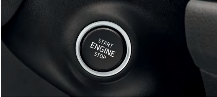
מערכת Kessy - כניסה והנעה ללא מפתח