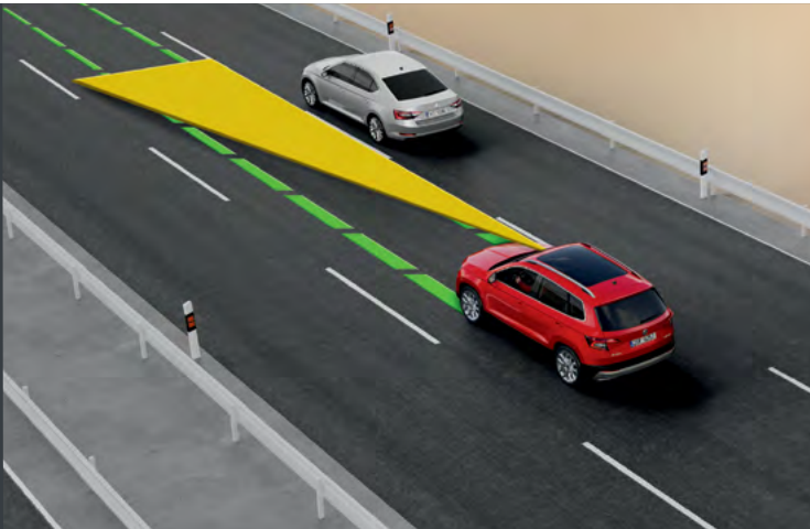
מערכת אקטיבית Lane assist