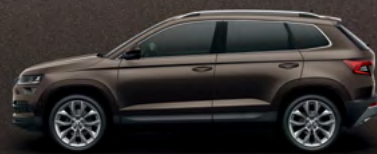
MAGNETIC BROWN METALLIC (0J)