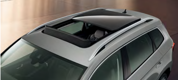
גג שמש פנורמי עם פתיחה חשמלית