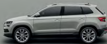
STEEL GREY UNI (M3)