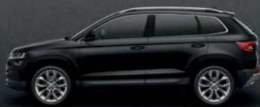
MAGIC BLACK METALLIC (1Z)