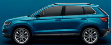
LAVA BLUE METALLIC (0J)