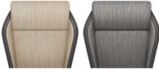
ריפודי בד - שחור / ב'ל