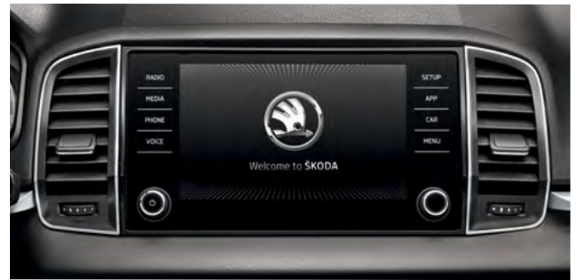
מערכת מולטימדיה מקורית בעלת מסך בגודל 8"