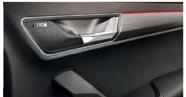
מערכת שמע Canton הכוללת 10 רמקולים