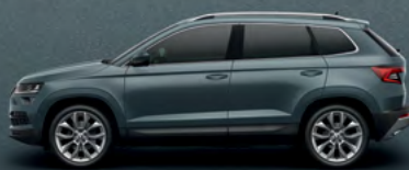
QUARTZ GREY METALLIC (F6)