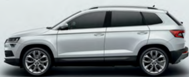
MOON WHITH METALLIC (2Y)