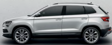
BRILIANT SILVER METALLIC (6E)