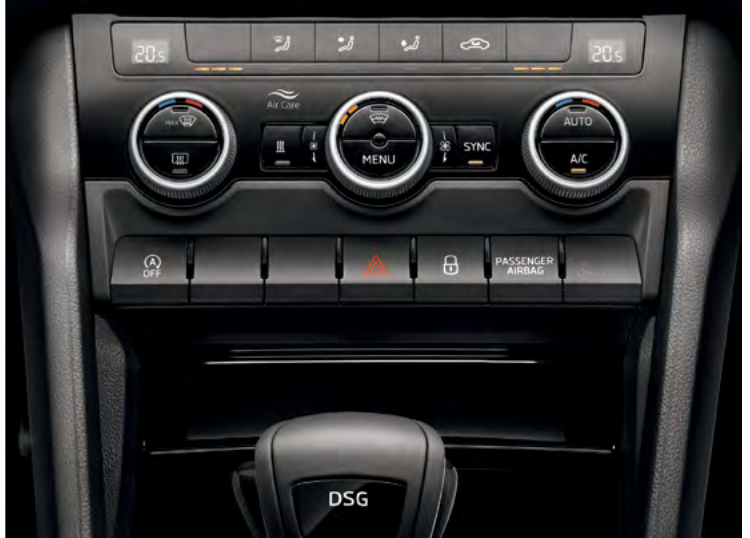
מערכת בקרת אקלים דיגיטלית - Climatronic בעלת 2 אזורים