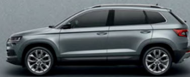
BUSINESS GREY METALLIC (2C)