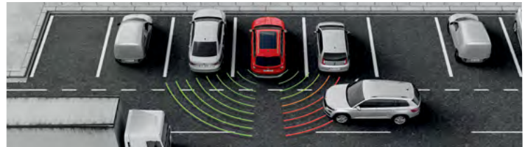
מערכת אקטיבית Rear traffic alert