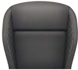
ריפודי בד - שחור