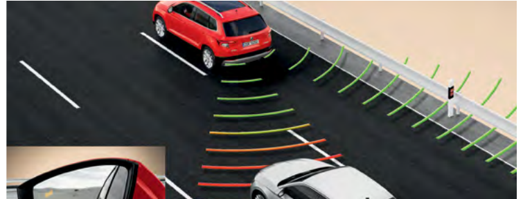
מערכת Blind spot detect