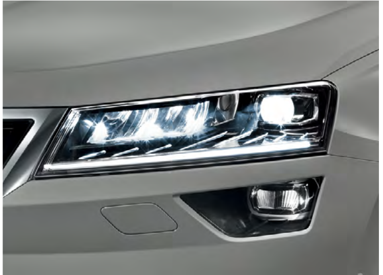
פנסים קדמיים Full LED