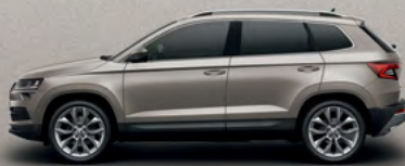
CAPPUCCINO BEIGE METALLIC (4K)