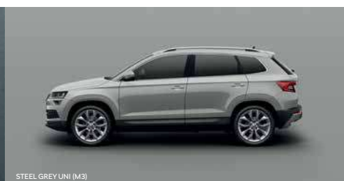
STEEL GREY UNI (M3)