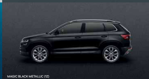
MAGIC BLACK METALLIC (1Z)