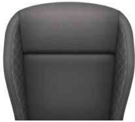
ריפודי בד - שחור