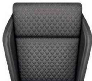
ריפודי בד משולב עור