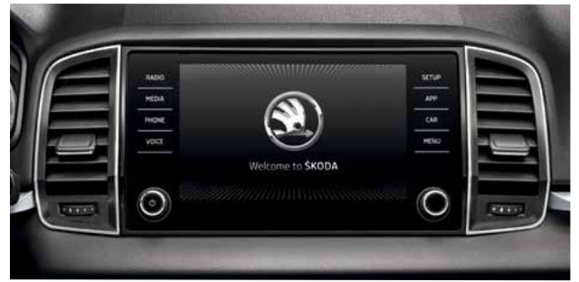
מערכת מולטימדיה מקורית בעלת מסך בגודל 8"