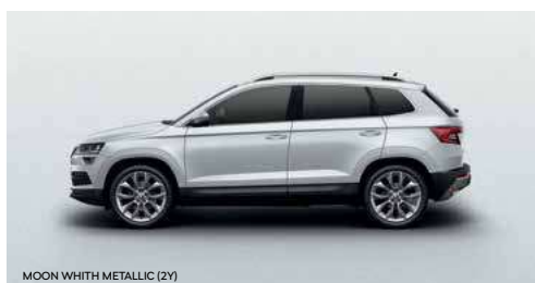
MOON WHIT METALLIC (2Y)