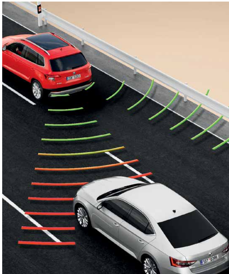
מערכת Blind spot detect