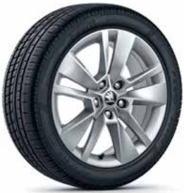
חישוקי סגסוגת 17"