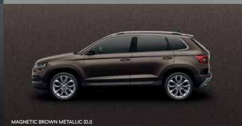
MAGNETIC BROWN METALLIC (0J)