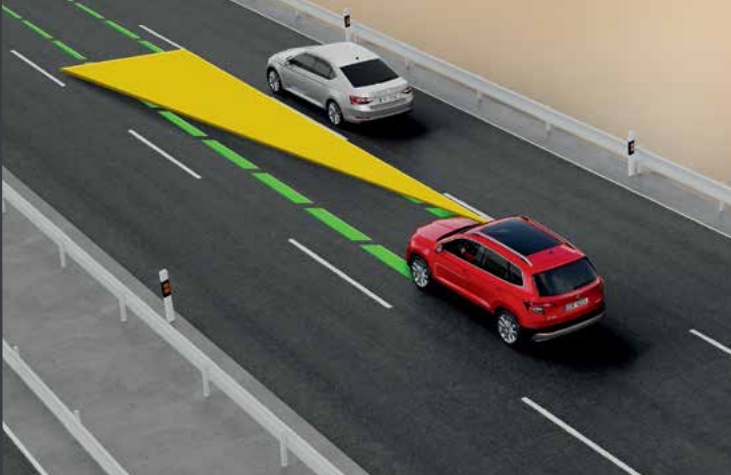
מערכת אקטיבית Lane assist