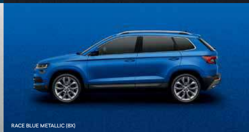
RACE BLUE METALLIC (8X)