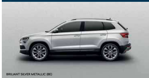
BRILIANT SILVER METALLIC (6E)