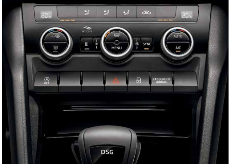
מערכת בקרת אקלים דיגיטלית מפועלת