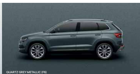
QUARTZ GREY METALLIC (F6)