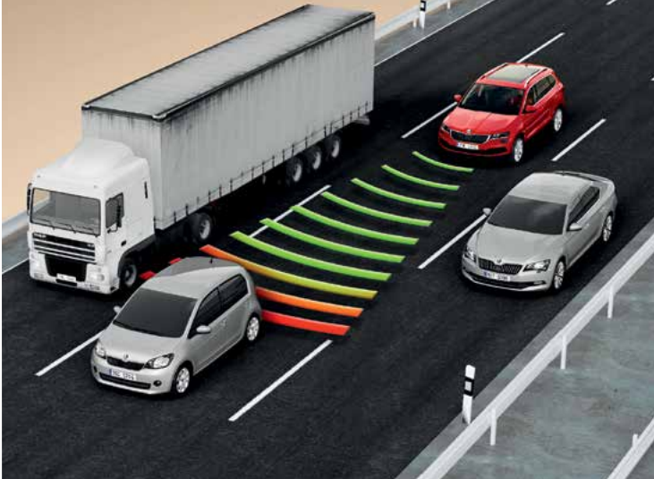
בקרת שיטת אדפטיבית - Adaptive cruise control