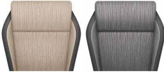
ריפודי בד - שחור / ב'ל