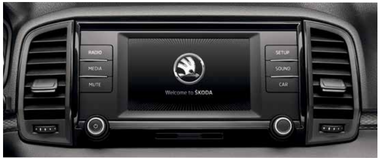
מערכת מולטימדיה מקורית בעלת מסך בגודל 6.5"