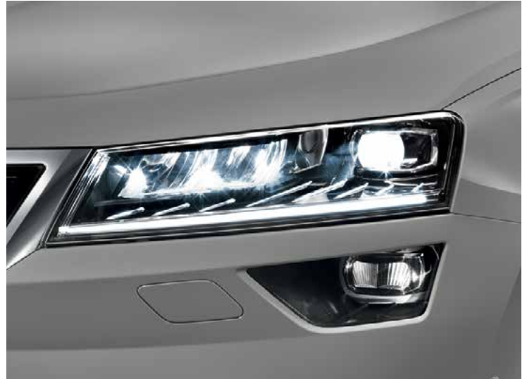
פנסים קדמיים Full LED