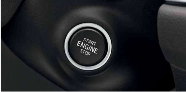
מערכת Kessy - פתיחה, נעילה והנעה ללא מפתח