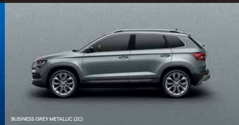
BUSINESS GREY METALLIC (2C)