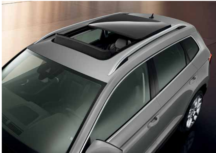
גג שמש פנורמי עם פתיחה חשמלית