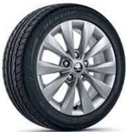
חישוקי סגסוגת 16"