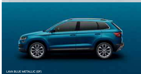
LAVA BLUE METALLIC (0F)