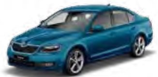
Lava Blue metallic 0F