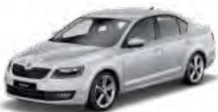
Brilliant Silver metallic 8E