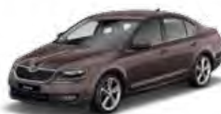
Topaz Brown metallic 4L