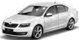
Candy White uni 9P