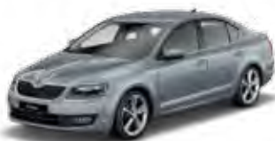
Platin Grey metallic 2G