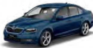
Pacific Blue uni Z5