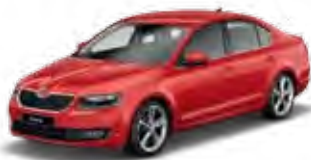
Corrida Red uni 8T