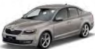
Cappuccino Beige metallic 4K