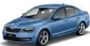
Denim Blue metallic 6O