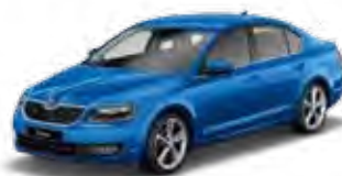
Race Blue metallic 8X