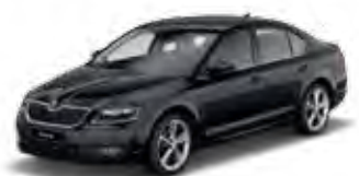
Black Magic pearl effect 1Z

התמונות להמחשה בלבד וכוללות תוספות שאינן חלק מהמפרט. החברה רשאית לשנות את המפרט בכל עת. המפרט המחייב הינו כפי שמופיע ע"ג ההזמנה באולם התצוגה. ט.ל.ח.