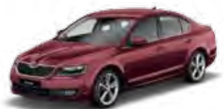
Rosso Brunello metallic X7