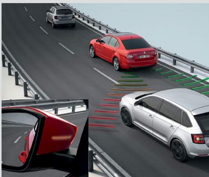
זיהוי שטח מת-מנטר שטחים מתיים באמצעות רדאר