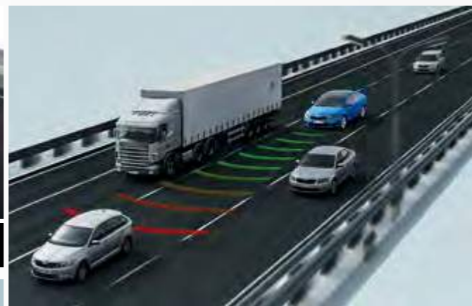
Adaptive Cruise Control בקרת שיוט אדפטיבית