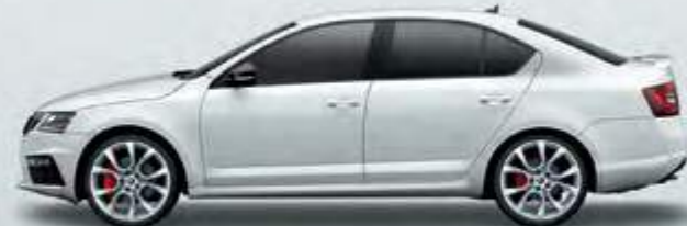
מטאלי Moon White (2Y2Y)