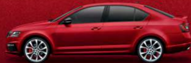
מטאלי Velvet Red (K1K1)