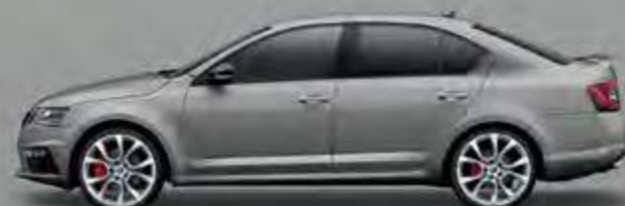
Steel Grey (M3M3)