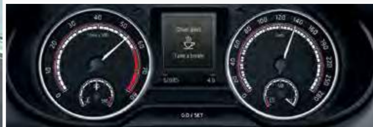
Driver Alert מערכת לזיהוי עייפות נהג