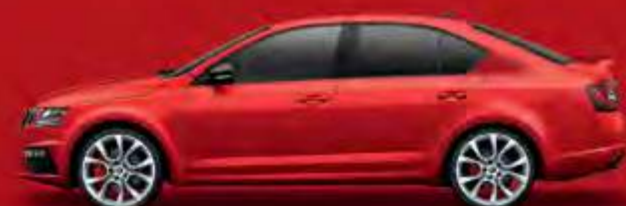
Corrida Red (8T8T)