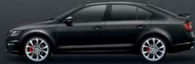
מטאלי Magic Black (1Z1Z)