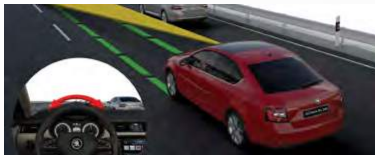
Lane Assist מערכת אקטיבית למניעת סטייה מנתיב

בסקודה מבינים שהבטיחות היא הדבר החשוב ביותר ולכן האוקטביה RS 245 מצוידת במגוון מערכות בטיחות אקטיביות ופסיביות השומרות על בטיחות הנוסעים ברכב.