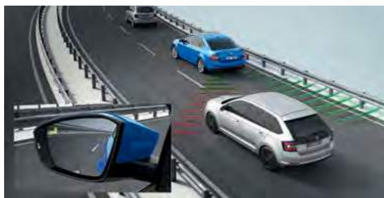
Blind Spot Detect מערכת לזיהוי כלי רכב ב-"שטח מת"