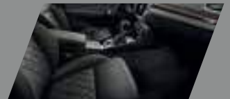
ריפודים שחורים בשילוב לוח מחוונים ופאנל שחור ואפור עם תפרים כסופים