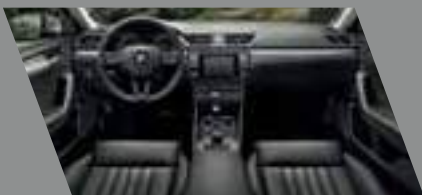
ריפודים שחורים אלקנטרה בשילוב לוח מחוונים ופאנל שחורים