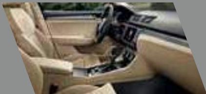
ריפודים שנהב אלקנטרה בשילוב לוח מחוונים ופאנל שחור ושנהב