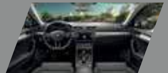
ריפודים שחורים בשילוב לוח מחוונים ופאנל שחור