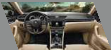
ריפודי עור מחוררים מאווררים שנהב בשילוב לוח מחוונים ופאנל שחור ושנהב