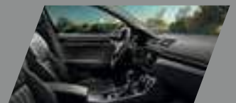
ריפודי עור מחוררים מאווררים שחורים בשילוב לוח מחוונים ופאנל שחור