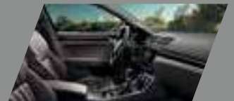
ריפודי עור מחוררים מאווררים חומים בשילוב לוח מחוונים ופאנל שחור