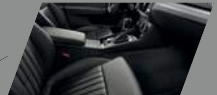
ריפודי עור מחוררים מאווררים שחורים בשילוב לוח מחוונים ופאנל שחור