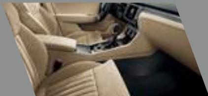
ריפודים שנהב אלקנטרה בשילוב לוח מחוונים ופאנל שחור ושנהב