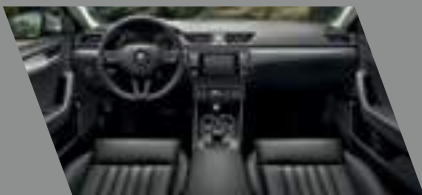
ריפודים שחורים אלקנטרה בשילוב לוח מחוונים ופאנל שחורים