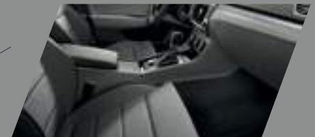
ריפודים אפורים בשילוב לוח מחוונים ופאנל שחור ואפור