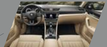
ריפודי עור מחוררים מאווררים שנהב בשילוב לוח מחוונים ופאנל שחור ושנהב