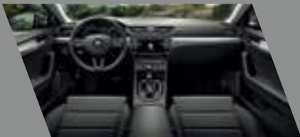
ריפודים שחורים בשילוב לוח מחוונים ופאנל שחור