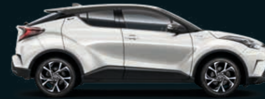
202/070 BLACK TOP לבן פנינה -