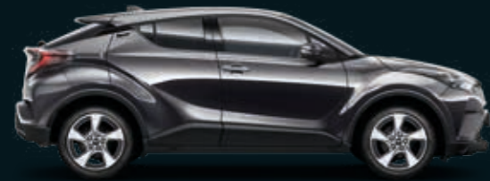
אפור גרניט מטאלי 163