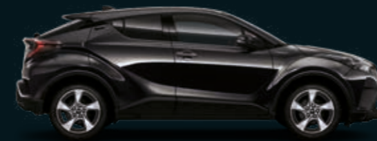
שחור נואר מטאלי 209