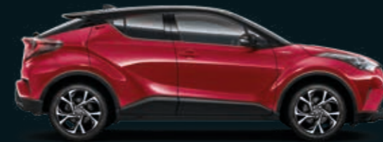
202/323 BLACK TOP אדום רוז מטאלי -