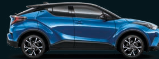
202/802 BLACK TOP כחול פיג'י -