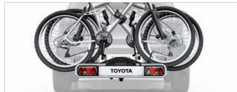
מתקן אופניים אחורי