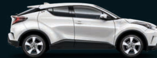
לבן צחור 040