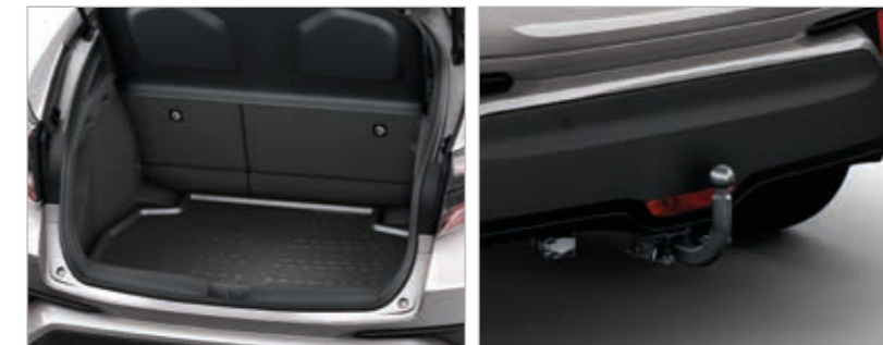
ציפוי מגן מפלסטיק שחור לתא מטען