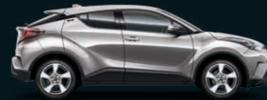
אפור מתכתי מטאלי 101