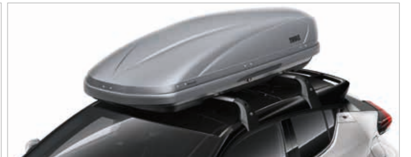
ארגז אחסון עליון