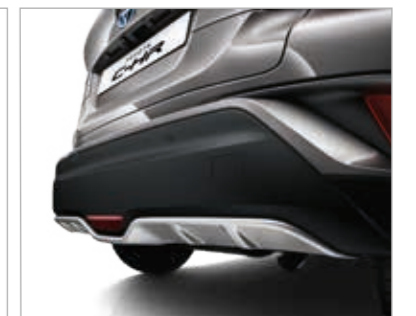
מגן חצאית אחורי דקורטיבי