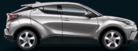
אפור מתכתי מטאלי 101