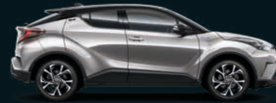
202/101 BLACK TOP אפור מתכתי מטאלי -