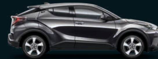
אפור גרניט מטאלי 163