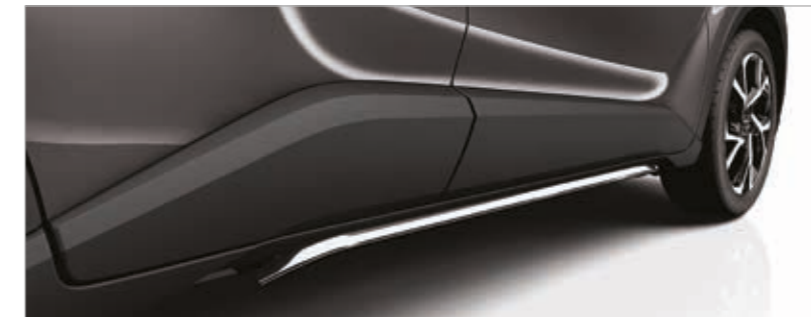
מגן צד תחתון