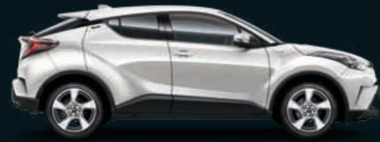
לבן פנינה מטאלי 070