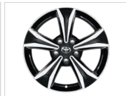
חישוקי סגסוגת קלה