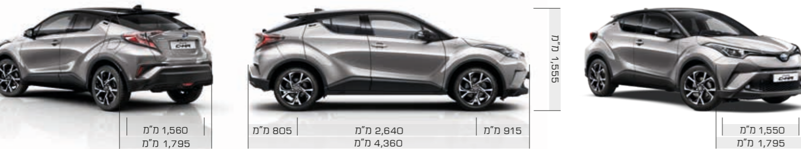
התמונות להמחשה בלבד.