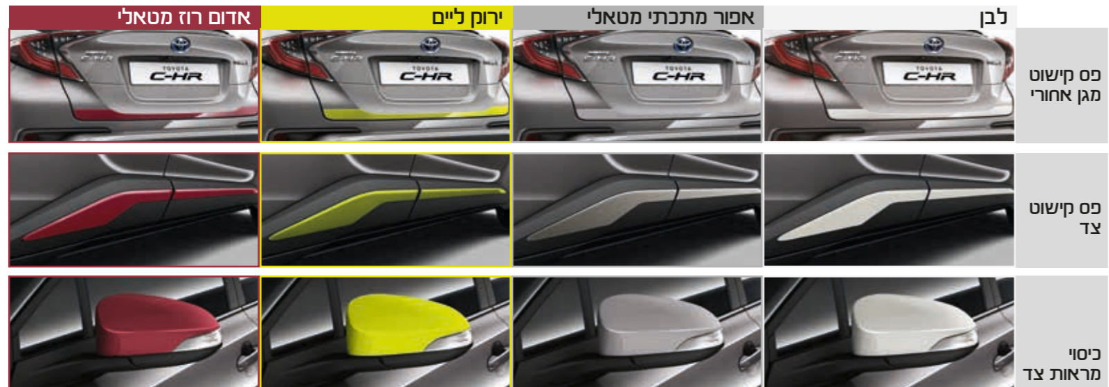
אדום רוז מטאלי