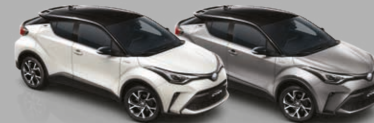
BLACK TOP לבן פנינה 202/070