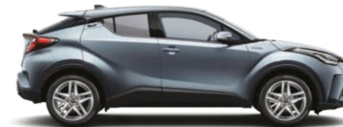
אפור תכלת מטאלי 3A1