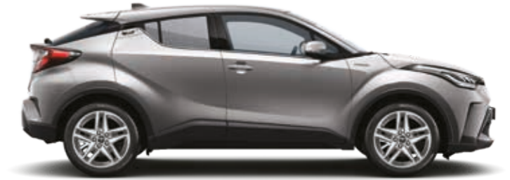
אפור מתכתי מטאלי 1A1