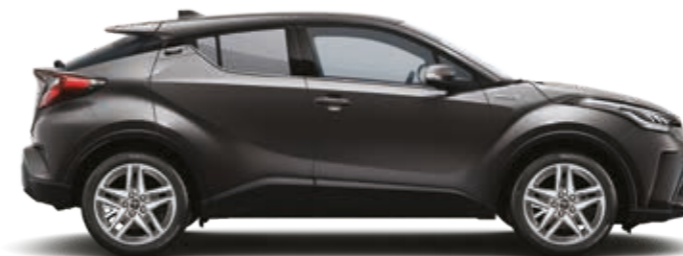
אפור גרניט מטאלי 1G3