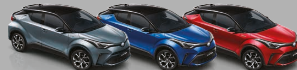
BLACK TOP אפור תכלית *202/1K3