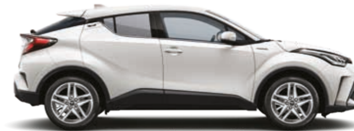
לבן צחור 040