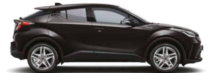
שחור נואר מטאלי 209