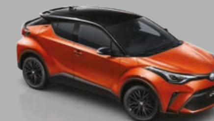
BLACK TOP כתום 202/4R8