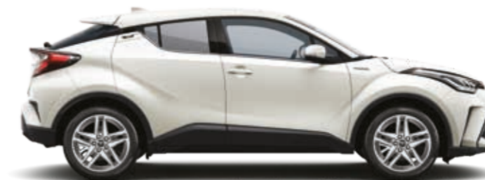
לבן פנינה מטאלי 070