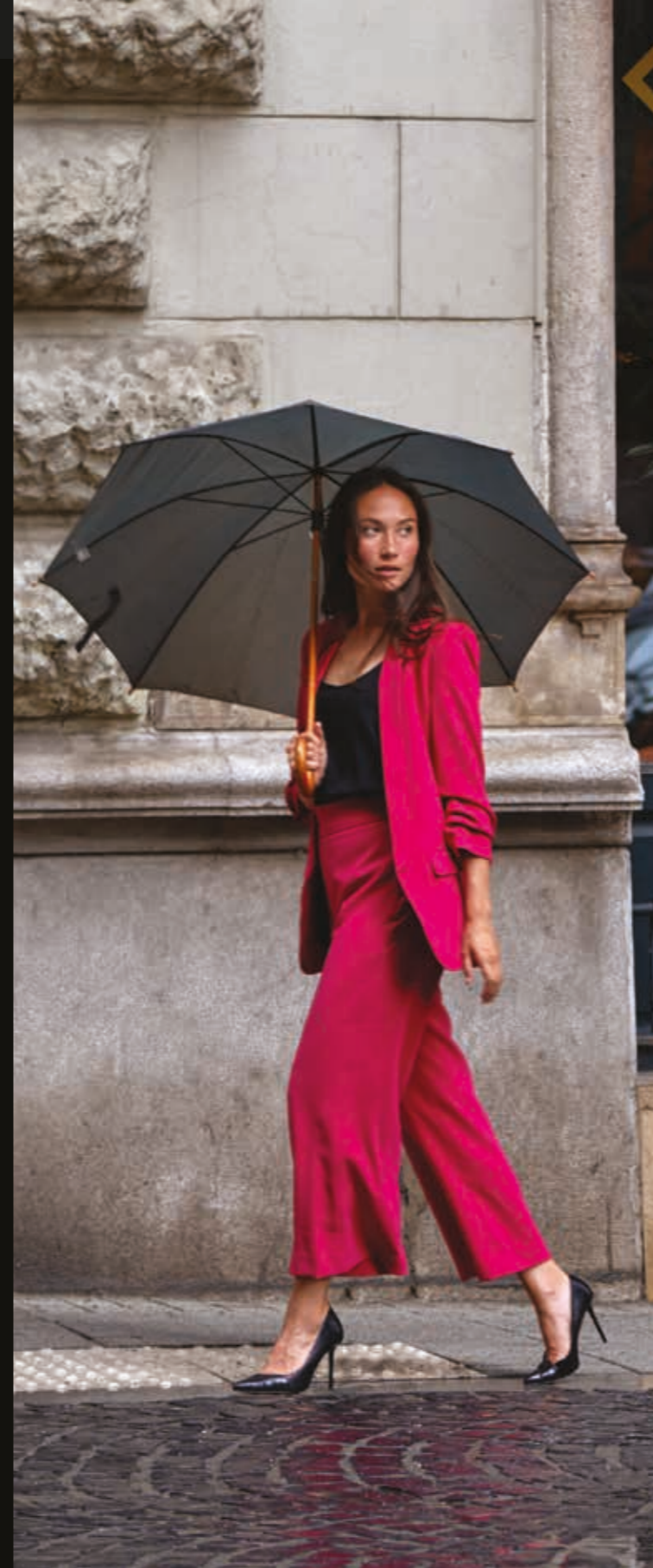
BLACK TOP כתום