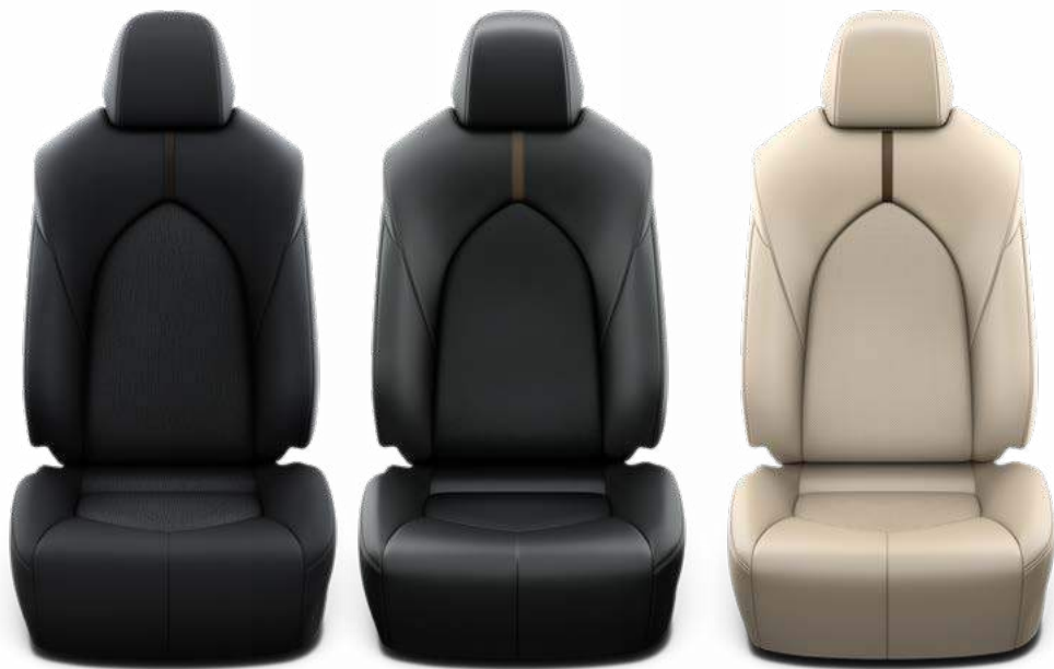
בד שחור - דגם LE ריפוד בד מהודר בצבע שחור מגיע בדגם LE בכל הצבעים החיצוניים