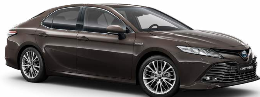
חום ברונזה מטאלי B-4X7