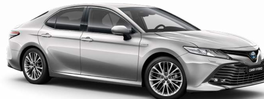
כסוף מטאלי B-1F7