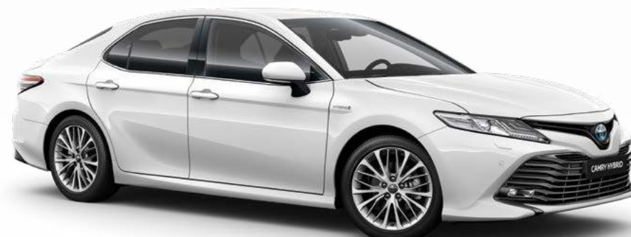
לבן צחור B-040