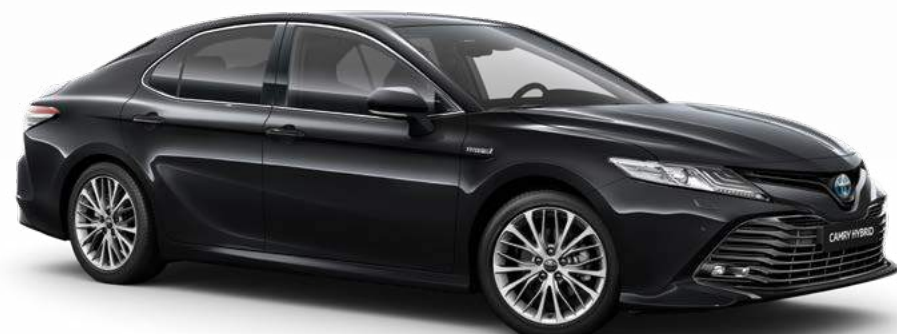
שחור מיקה מטאלי B-218