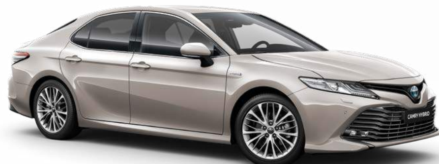
שמפניה מתכתי B-4X1