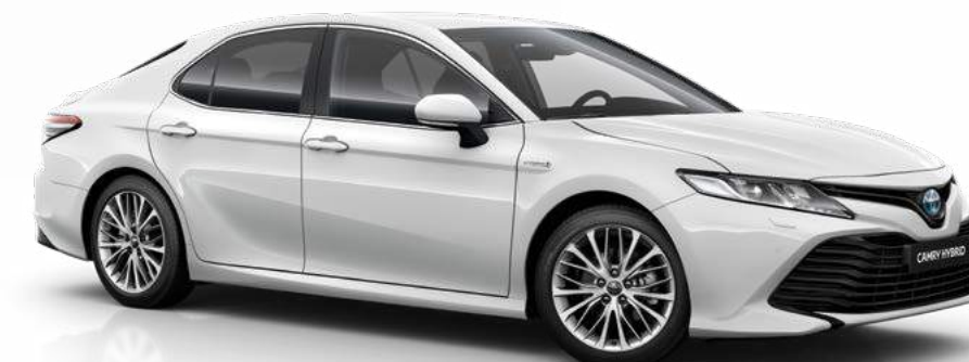
לבן פנינה מטאלי B-089