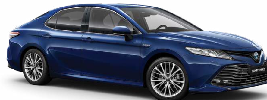
כחול כהה מטאלי B-8W7