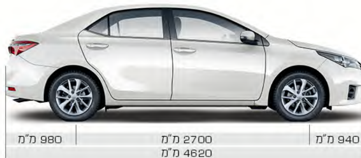
980 מ"מ | 2700 מ"מ | 940 מ"מ 4620 מ"מ