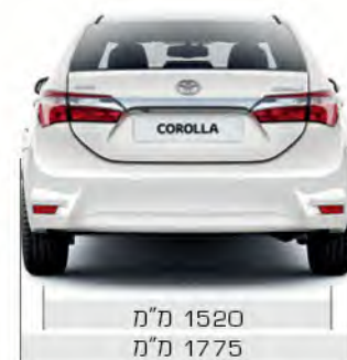
1520 מ"מ 1775 מ"מ

הנתונים להמחשה בלבד. הנתונים המוצגים הינם של דגם GLI