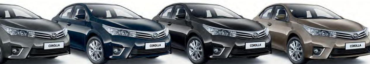
אמור כהה מטאלי 1G3