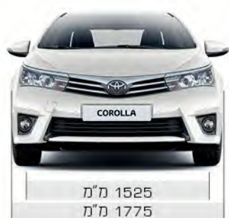
1525 מ"מ 1775 מ"מ