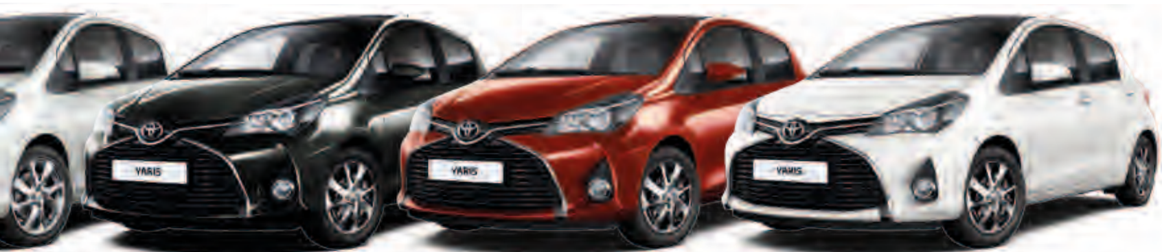
שחור מטאלי 209