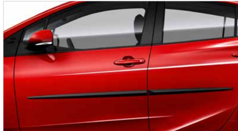
4. סט פסי קישוט