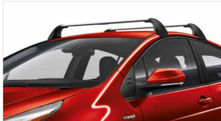
1. מוטות רוחב