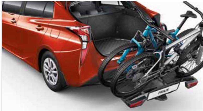
3. מתקן אופניים