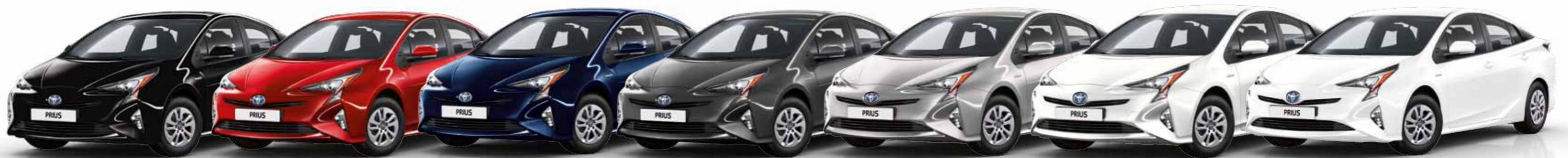
שחור מטאלי 218