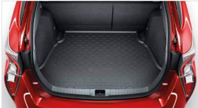
5. ציפוי מגן מפלסטיק שחור לתא מטען התמונות להמחשה בלבד.