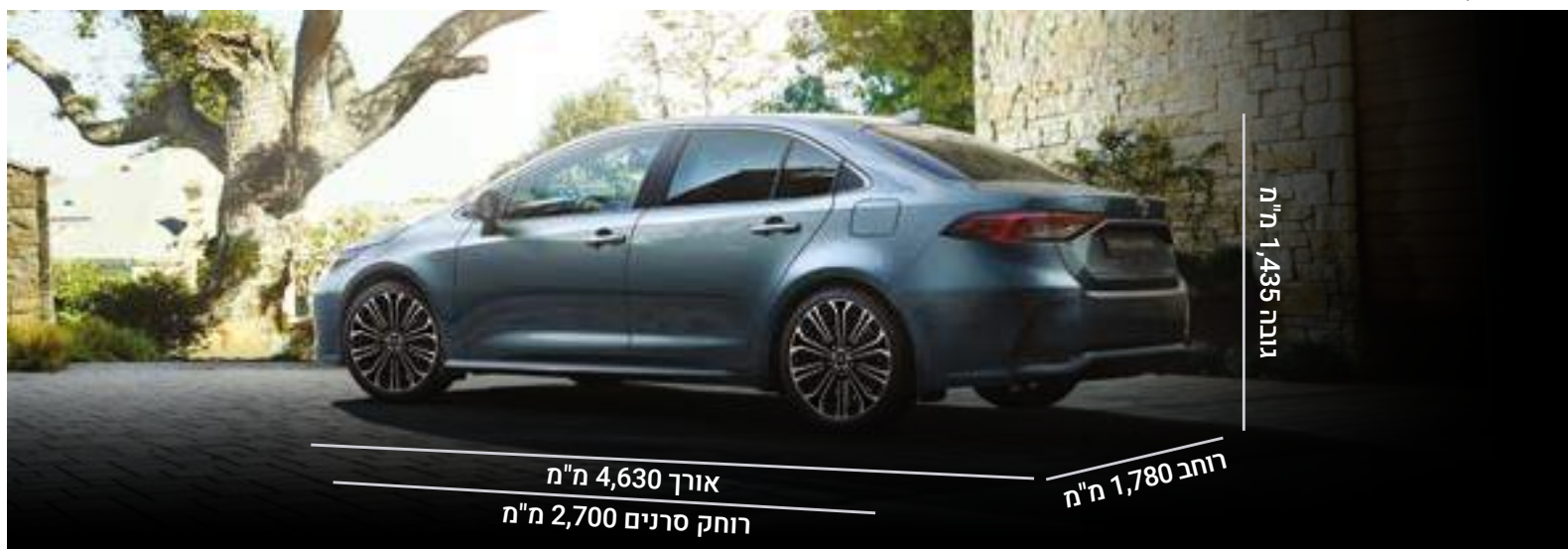
התמונה להמחשה בלבד.