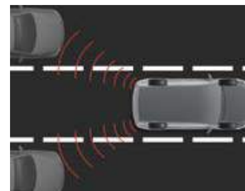
מערכת זיהוי רכבים בשטח מת**