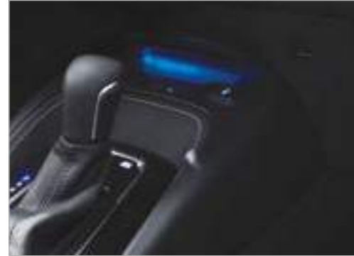
משטח טעינה לטלפון אלחוטי