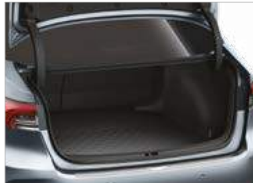
אמבטיה לתא מטען