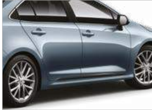
סט פסי קישוט לדלתות בצבע שחור