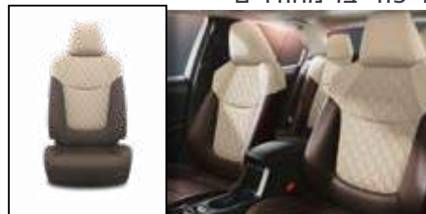
ריפוד בד מהודר בצבע חום-בז'. מגיע בדגמי SENSE ו-LIMITED היברידיים בלבד בצבעים החיצוניים לבן פנינה מטאלי ושחור נואר מטאלי.