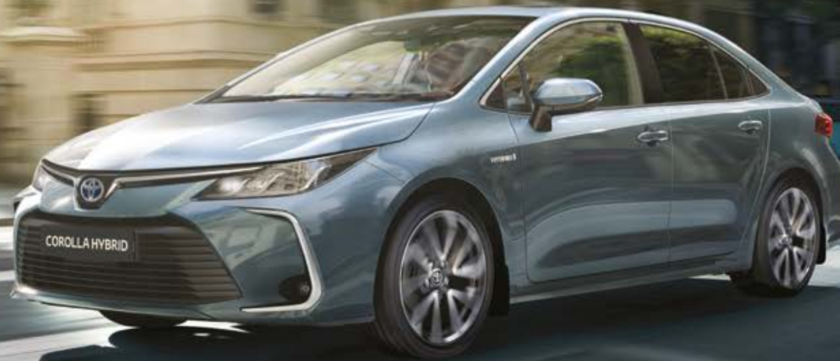
התמונה להמחשה בלבד.