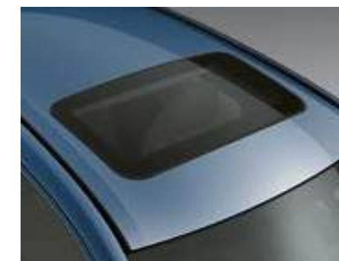
חלון שמש נפתח חשמלית (Sunroof)**