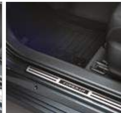
סט 4 קישוטי סף לדלתות עם מיתוג COROLLA