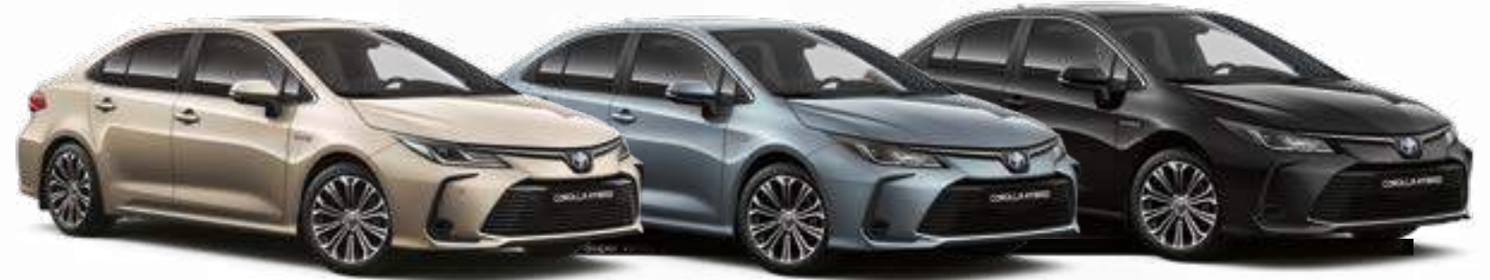
בז' מיקה 587