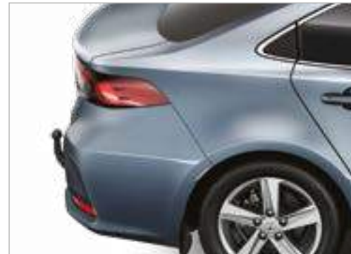
זוג גרירה נשלף