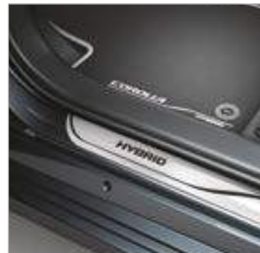
סט 4 קישוטי סף לדלתות עם מיתוג HYBRID