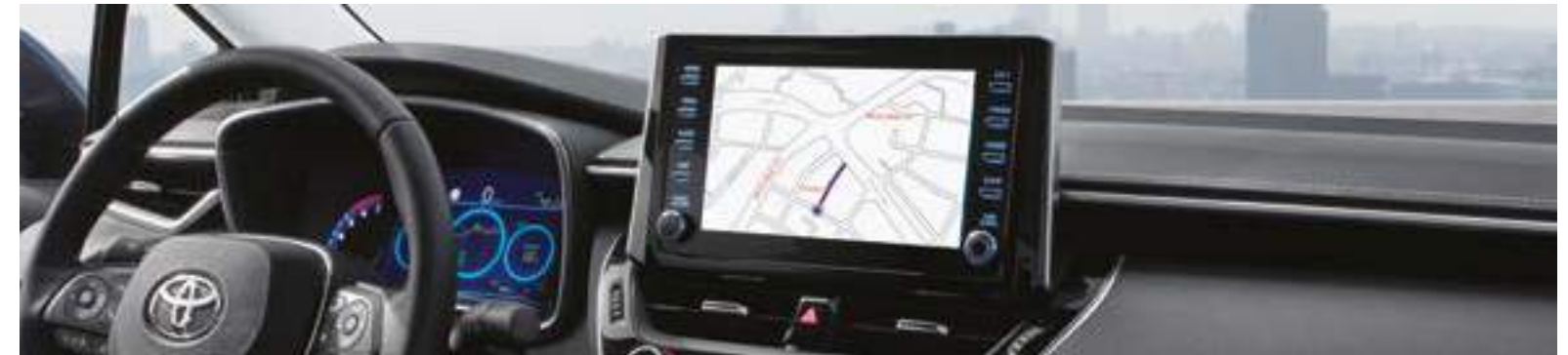
מערכת מולטימדיה בהתקנה מקומית ומסך 9"