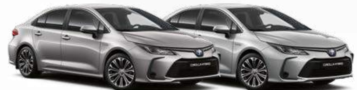
אפור מתכתי מטאלי 1א0