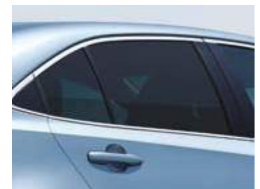
שמשות אחוריות כהות**

*מערכת המולטימדיה בדגם LIMITED הינה מערכת מקורית, וגודל המסך שלה הינו 8". **זמין בחלק מרמות הגימור. התמונות להמחשה בלבד