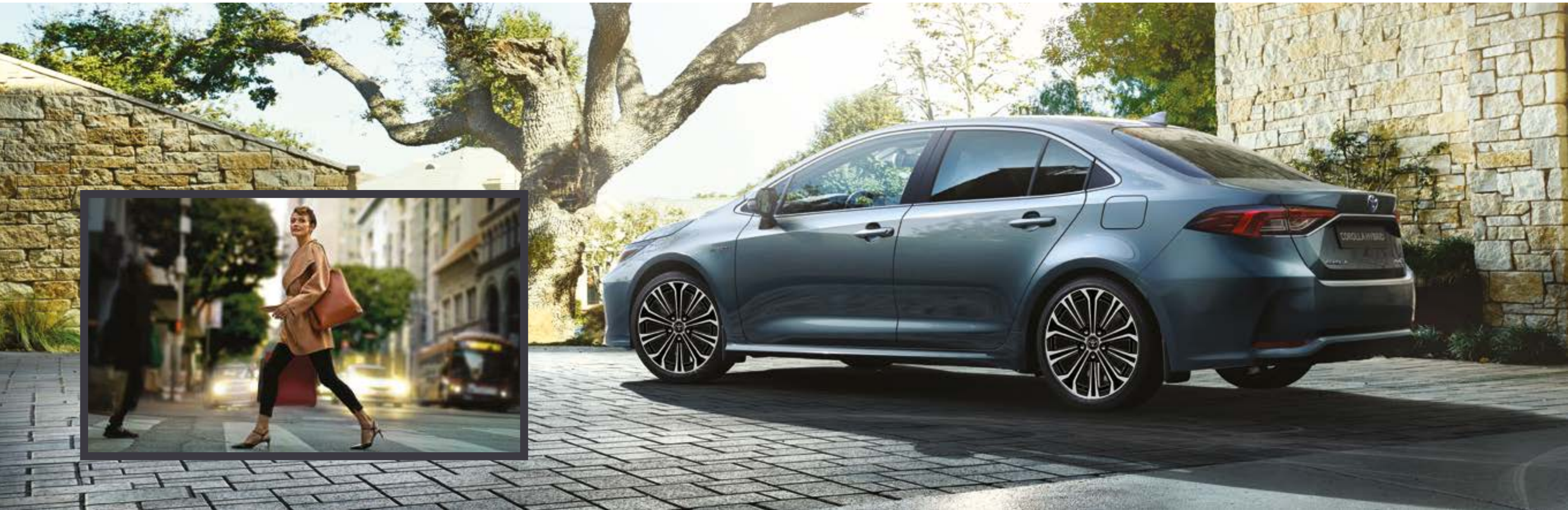
התמונות להמחשה בלבד.

אנחנו עיצבנו אותה מחדש כדי שאתם תמשכו את כל המבטים