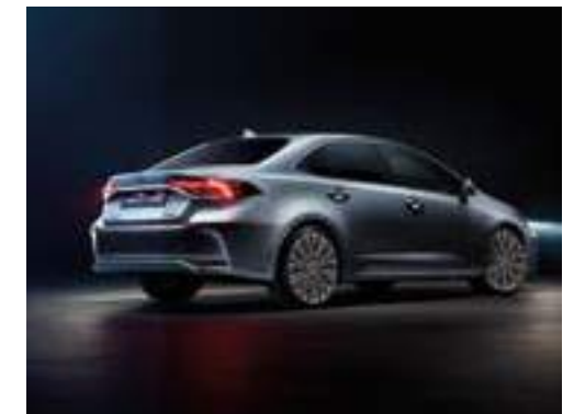
כיבוי תאורה מושהה FOLLOW ME HOME