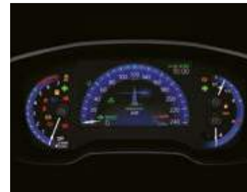
מסך נתונים צבעוני בלוח המחוונים 7"