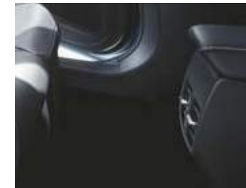
פתחי מיזוג אחוריים ליושבים במושב האחורי