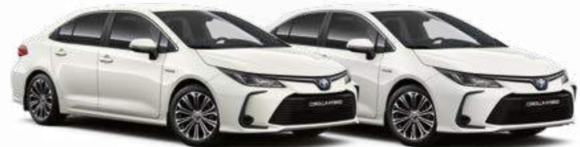
לבן צחור 040