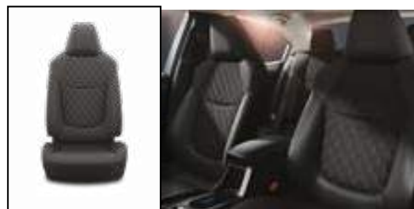
ריפוד בד מהודר בצבע שחור