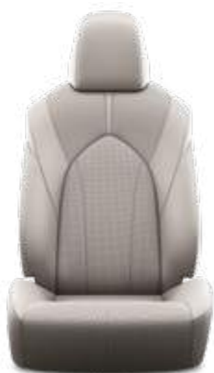
ריפוד עור בצבע אפור E-XCLUSIVE 4X4