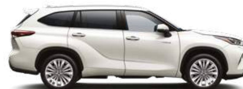
070 לבן פנינה מטאלי