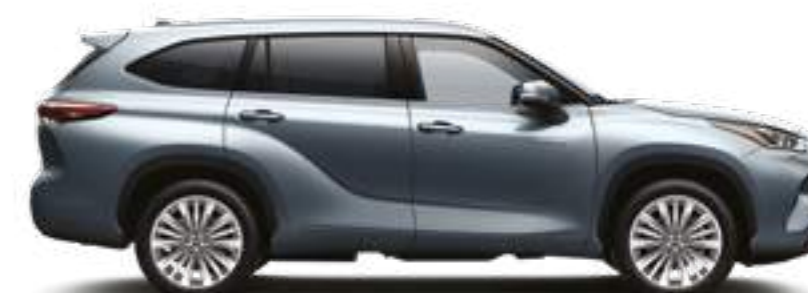
1K5 כחול טיטניום מטאלי*