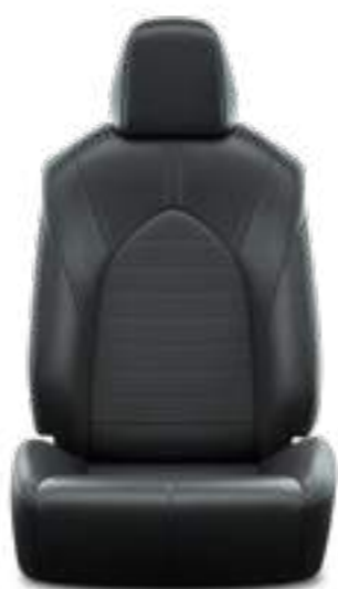
ריפוד דמוי עור בצבע שחור E-MOTION 4X4