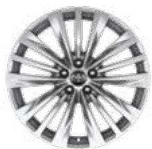
חישוקי סגסוגת קלה 20" בדגם E-XCLUSIVE 4X4 בלבד.