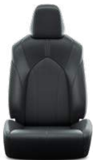
ריפוד עור בצבע שחור E-XCLUSIVE 4X4