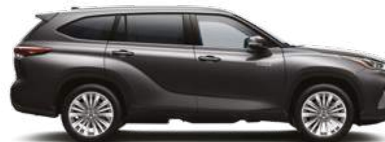
1G3 אפור כהה מטאלי