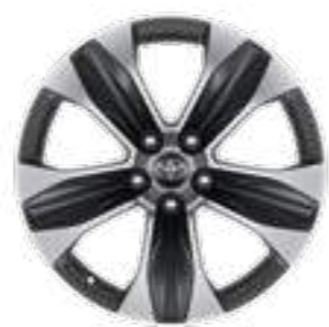
חישוקי סגסוגת קלה 18" בדגם E-MOTION 4X4 בלבד.