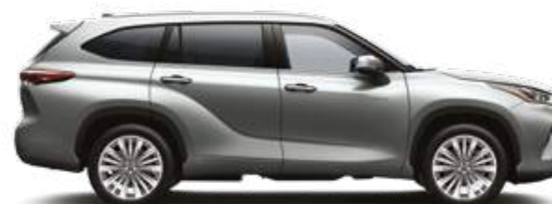
1J9 כסוף מטאלי