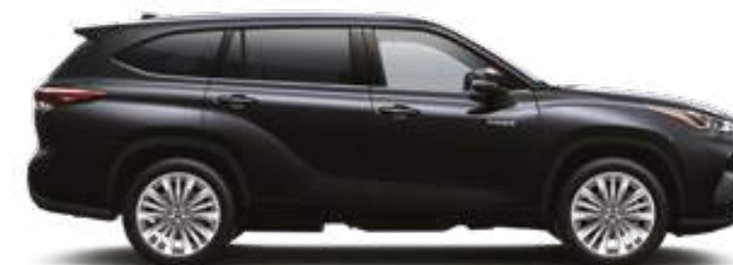
218 שחור מיקה מטאלי