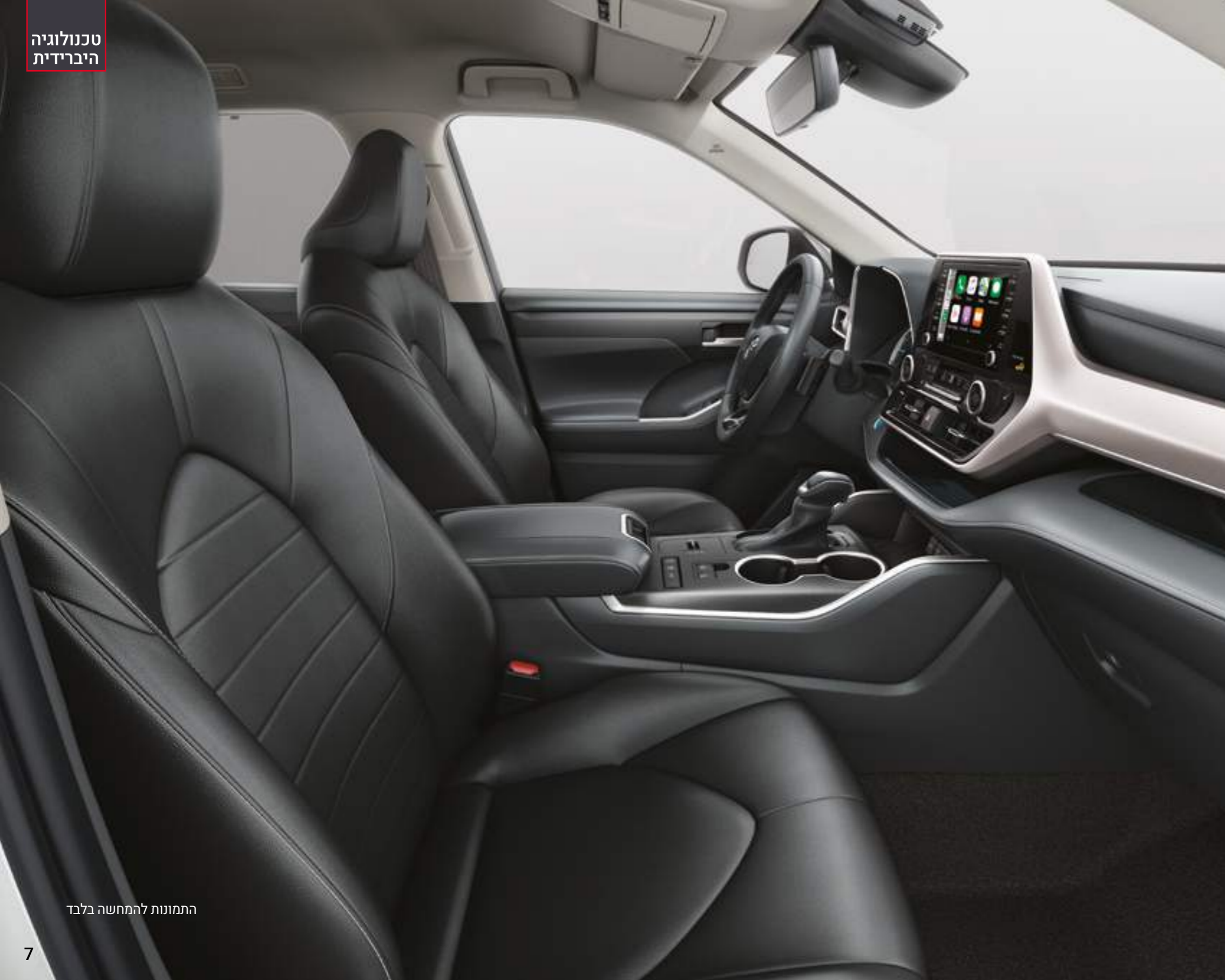
התמונות להמחשה בלבד