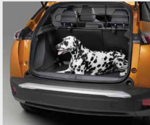
גריל הפרדה לתא מטען