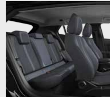
ריפוד אפור שחור