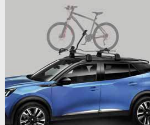
מנשא לאופניים (בדרש מוטות רוחב)