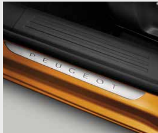
סט ספי דלת