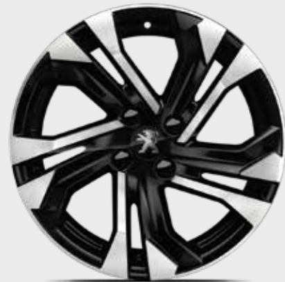
חישוקי סגסוגת SALAMANCA 17"