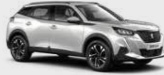
לבן פנינה מטאלי PEARLESCENT WHITE | N9M6