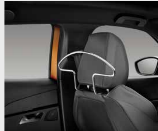
סט קולבים למשענות הראש הקדמיות