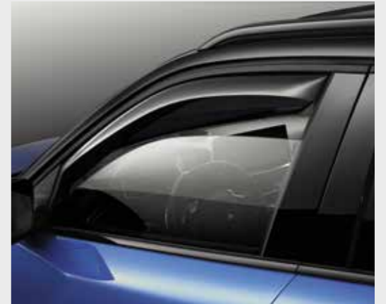
סט מסיטי רוח לחלונות הקדמיים