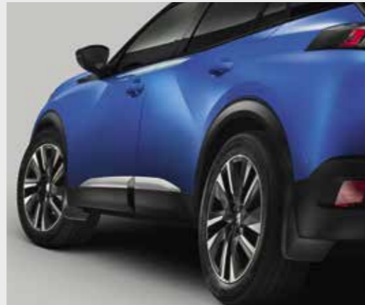
סט מגני בוץ (קדמיים + אחוריים)