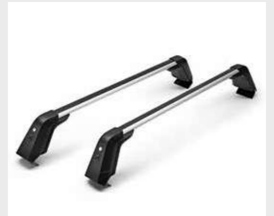
מוטות רוחב (על גג הרכב)