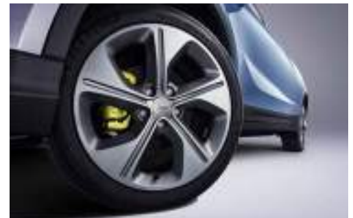
* בדגמי PRO בלבד.