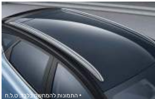
* התמונות להמחשה בלבד. ט.ל.ח.