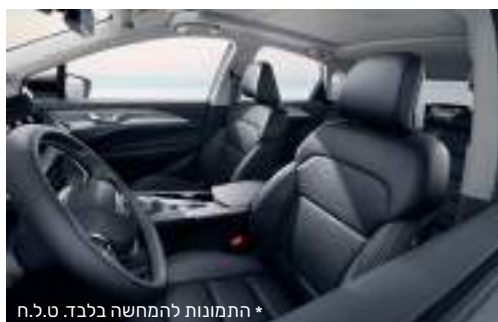
* התמונות להמחשה בלבד. ט.ל.ח

* למעט בתוספת Bi-Tone ** זמינות הממשקים, היישומים והפעלתם, בכפוף ליצרן מערכות ההפעלה ובאחריותו בלבד.