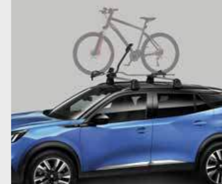
מנשא לאופניים (נדרש מוטות רחב)