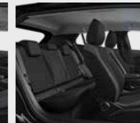
ACTIVE (ריפוד אפור כהה)