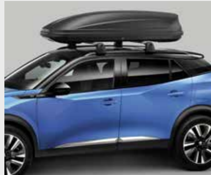
מגוון תאי אחסון עילאיים לבחירה