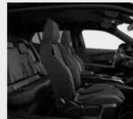
GT 155 ריפוד המשלב: בד, אלקנטרה ודמוי עור בגווני אפור ושחור