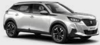
לבן פנינה מטאלי PEARLESCENT WHITE | N9M6

לרשותך עומד מגוון רחב של צבעים שיאפשר לך להביע את עצמך באופן מלא.