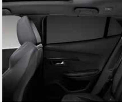
סט רשתות הצללה*