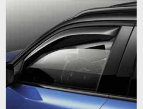
סט מסיטי רוח לחלונות הקדמיים