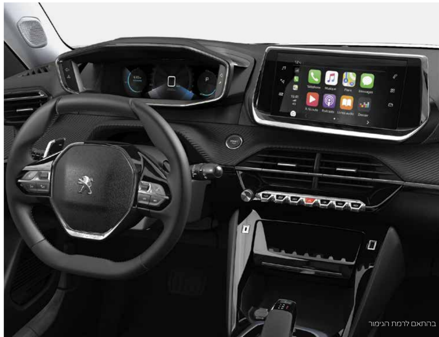
בהתאם לרמת הנימור

לוח המחוונים הדיגיטלי* – i-Cockpit 3D – מקרין את כל המידע הנדרש לנהיגה בשכבות שונות היוצרות אפקט תלת-ממדי מרהיב. לוח המחוונים ממוקם גבוה יותר והוא בדיוק בשדה הראיה של הנהג, דבר המשפר את בטיחות הנהיגה. הגרפיקות החדות והצבעוניות בלוח המחוונים ניתנות להתאמה כדי להעניק שפע מצבי תצוגה המאפשרים לנהג לבחור את התצוגה המתאימה לו.