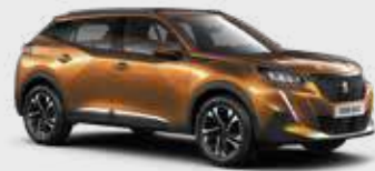
כתום מטאלי ORANGE FUSION | 2SM0