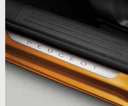
סט ספי דלת