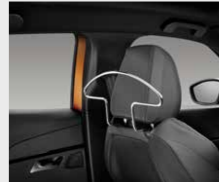
סט קולבים למשענות הראש הקדמיות