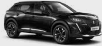
שחור מטאלי PERLA NERA BLACK | 9VM0