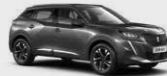
אפור כהה מטאלי PLATINIUM GREY | VLMO