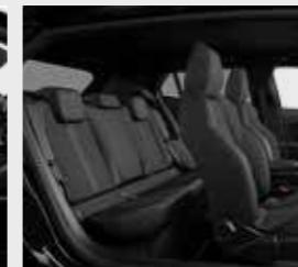
GT (ריפוד בצבע אפור משולב דמוי עור)