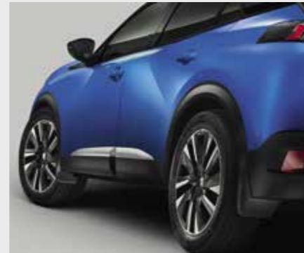
סט מגני בוץ (קדמיים + אחוריים)