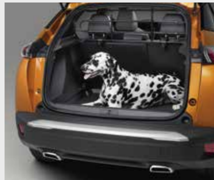
גריל הפרדה לתא מטען