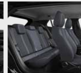
PREMIUM (ריפוד אפור-שחור עם תפר טורקיז)