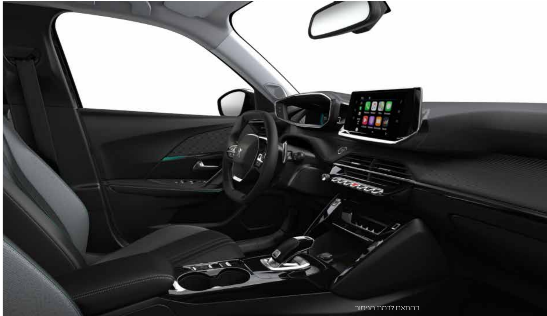
בהתאם לרמת הגימור