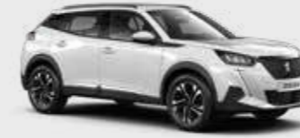
לבן בנקיז BANQUISE | WPP0