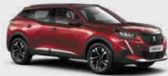
אדום מטאלי ELIXIR RED | VHMS