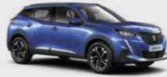
כחול פנינה מטאלי VERTIGO BLUE | SMM6