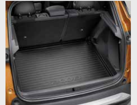
משטח פלסטיק לתא מטען

*לדגמי Active **אביזר לא מקורי כל האביזרים המופיעים הינם בתשלום נוסף