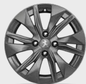
חישוקי סגסוגת 16" ELBORN בדגמי ACTIVE