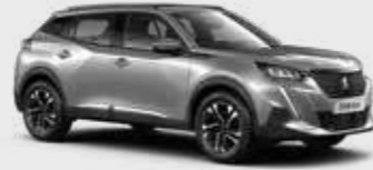
כסוף כהה מטאלי ARTENSE GREY | F4M0