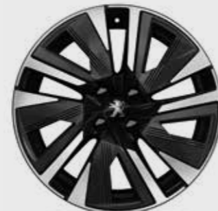
חישוקי סגסוגת 18" BUND בדגמי GT 155