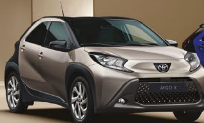
ב' ג'ינג'ר 2VJ - 4U9/209