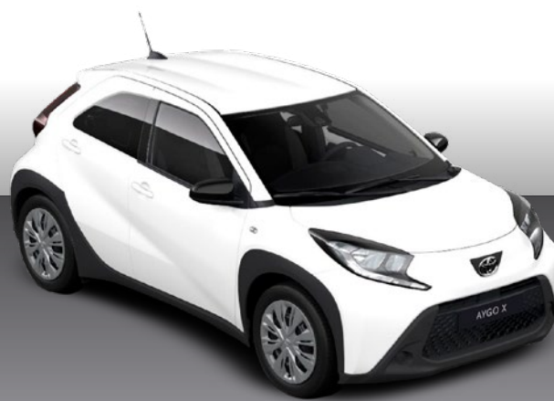
לבן צחור 040