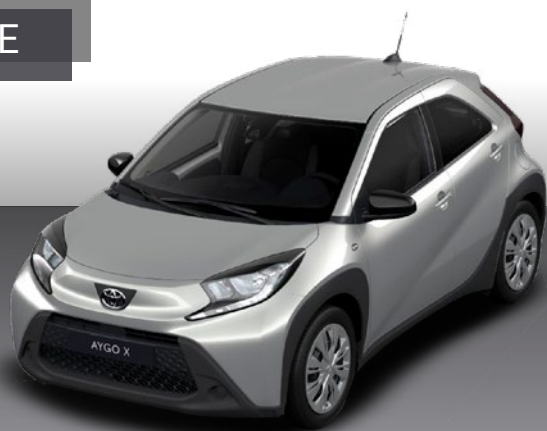
כסף מאטלי 1L0