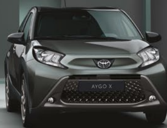
ירוק הל 2VK - 6W4/209