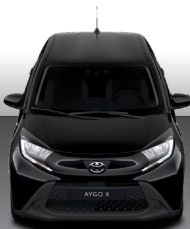
שחור מטאלי 209