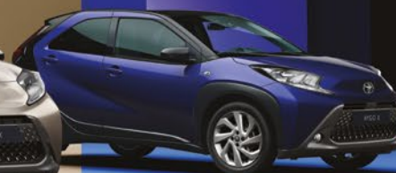
כחול ג'וניפר 2VL - 8Y8/209