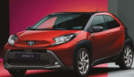
אדום צ'ילי 2VH - 3U4/209