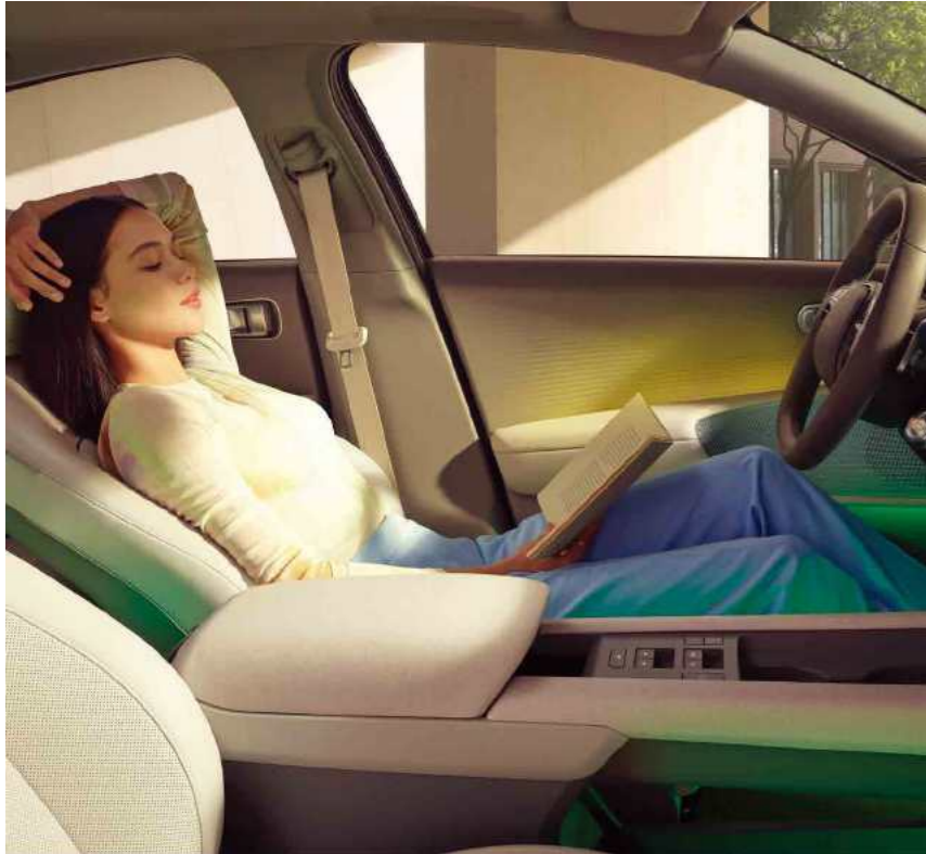
מושבים קדמיים מתכווננים הניתנים להטיה מלאה (Relaxation Comfort Seat)**

גלו את המגוון הרחב של מאפייני הנוחות ב-IQ6.