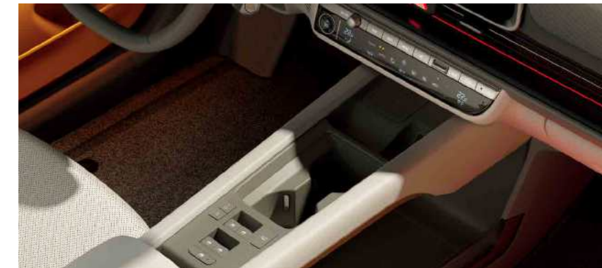
קונסולה מרכזית צפה

תאורה אינטראקטיבית על גלגל ההגה הכוללת 4 נורות LED המציגה את חיווי הטעינה של הסוללה ומצבי הנהיגה השונים.