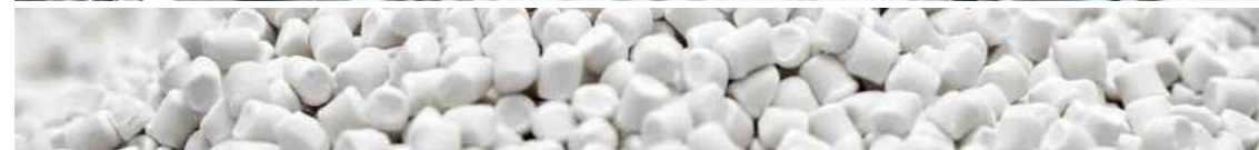
תקרת בד BIO-PET החומר המשמש לייצור התקרה מגיע מסיבים ידידותיים לסביבה המיוצרים מקני סוכר.