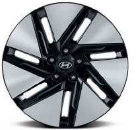
חישוקי סגסוגת בקוטר 18"