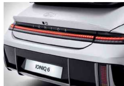
פנסים אחוריים בתאורת LED