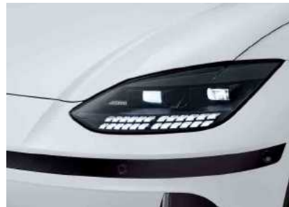
תאורת מטריקס LED קדמית מלאה*