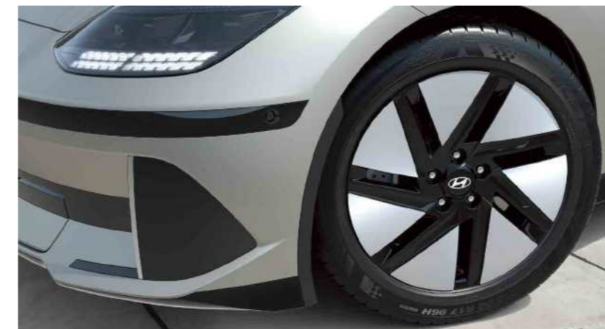
חישוקי סגסוגת בקוטר 18"