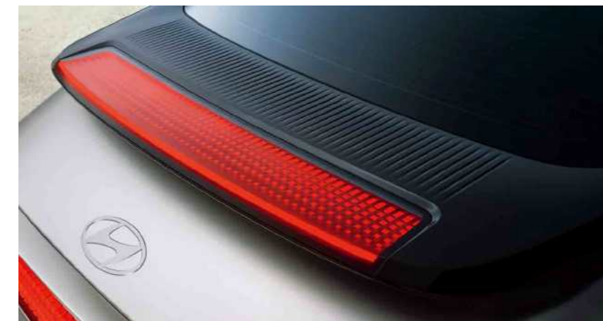
תאורת בלם אחורי בעיצוב פיקסל