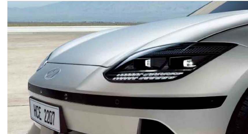
פנסים קדמיים מסוג LED בעיצוב פיקסלים