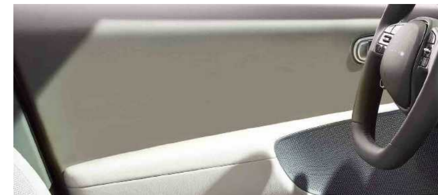
דלת חלקה ללא כפתורים

הכפתורים עברו מהדלתות הקדמיות אל הקונסולה המרכזית כדי להגדיל את החלל ואת מקום האחסון.