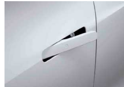
ידיית דלתות שטוחות