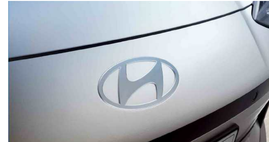
מכסה מנוע שטוח וסמל יונדאי בעיצוב חדש