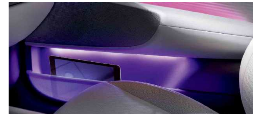
תאי אחסון שקופים בדלתות