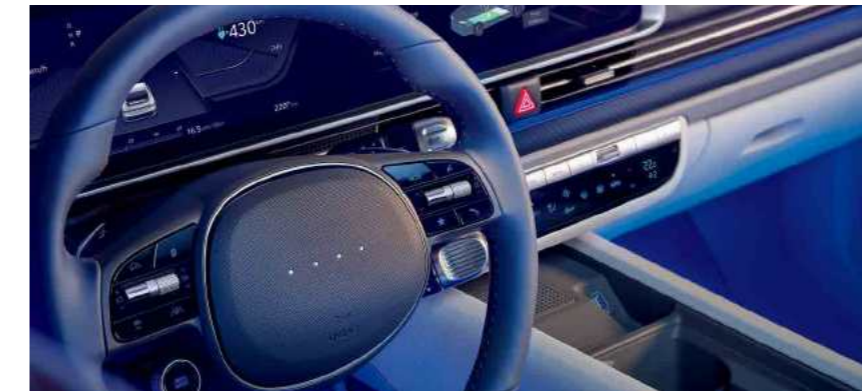
תאורת LED משתנה*

תאורה אינטראקטיבית על גלגל ההגה הכוללת 4 נורות LED המציגה את חיווי הטעינה של הסוללה ומצבי הנהיגה השונים.