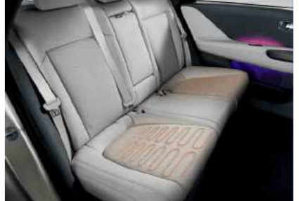
חימום מושבים אחוריים*