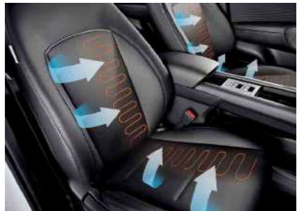
חימום מושבים קדמיים