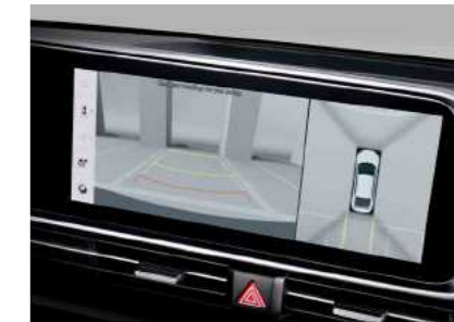
מערך 4 מצלמות היקפי (AVM)*