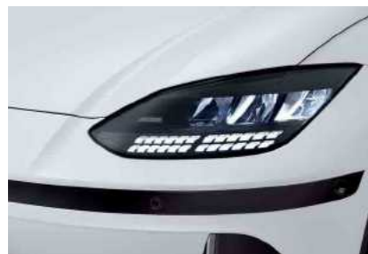
פנסים ראשיים + תאורת יום LED