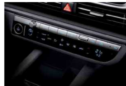
בקרת אקלים דיגיטלית ממוצלת