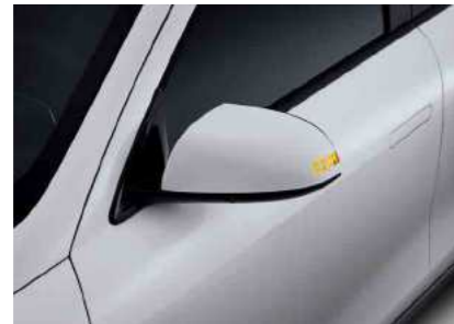
איתות במראות צד