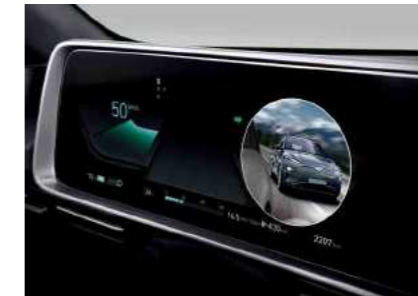
הצגת צילום חי של "שטח מת" על גבי לוח המחוונים הדיגיטלי בעת הפעלת איתות (BVM)*