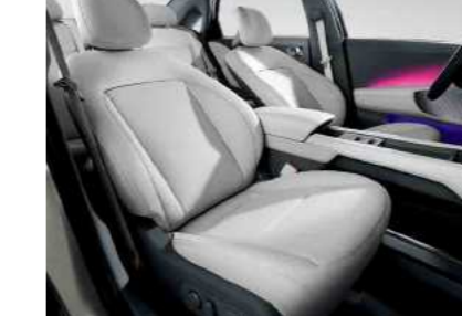
מושבים קדמיים מתכוונים הניתנים להטיה מלאה*