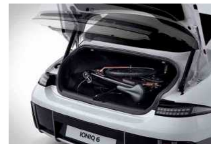
דלת תא מטען חשמלית