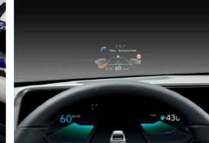
תצוגה עילית על גבי השמשה (HUD)*