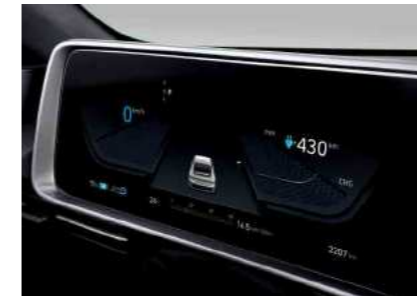
לוח מחוונים דיגיטלי מלא בגודל 12.3"