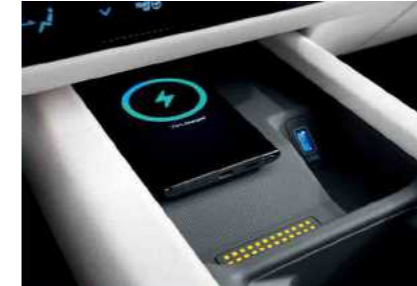
טעינה אלחוטית לנייד (למכשירים תומכים בטכנולוגיה לפי תקן טעינה Qi)