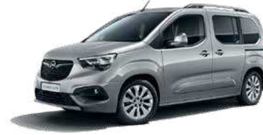
Quartz Grey (G4I) כסף מטאלי*