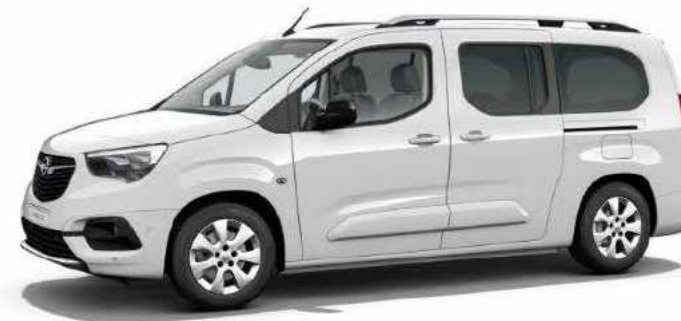
רמת גימור 7 – ELEGANCE PLUS מושבים