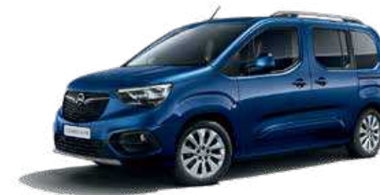
Night Blue (GBT) כחול מטאלי*