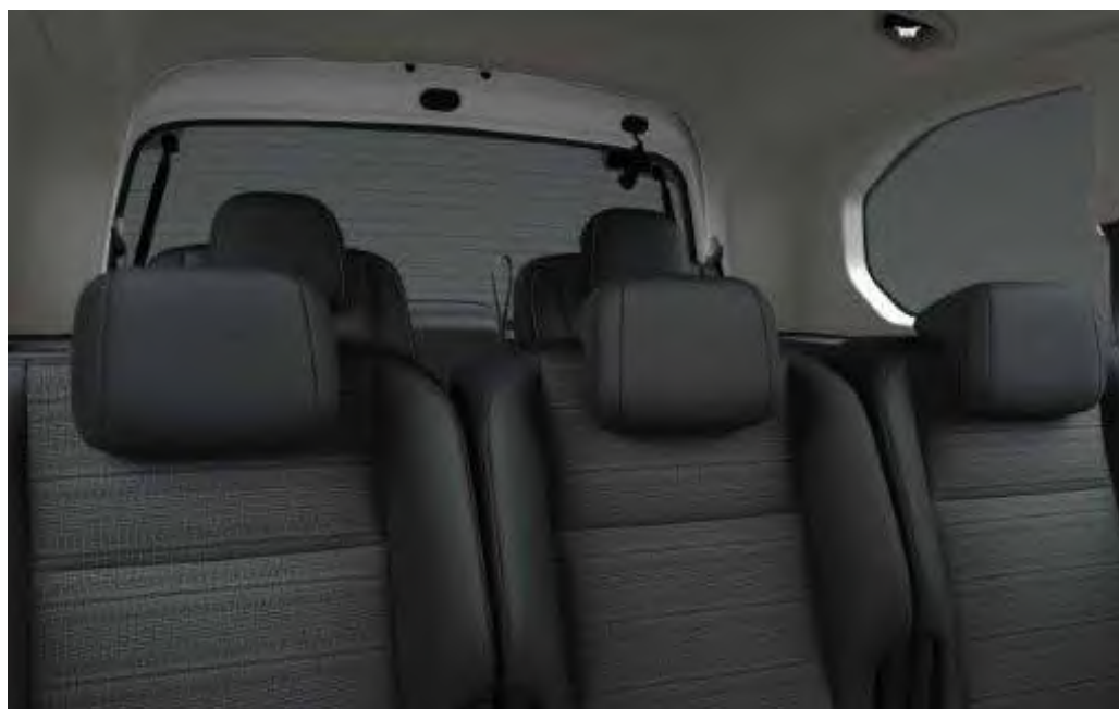
ריפוד בד בצבע אפור משולב עם שחור