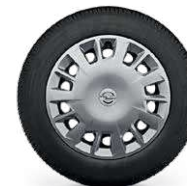
חישוקי פלדה 16" לדגמי ENJOY/EDITION PLUS 5 מושבים