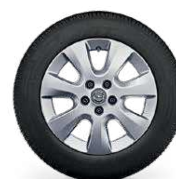
חישוקי סגסוגת 16" לדגמי ELEGANCE PLUS 7 מושבים