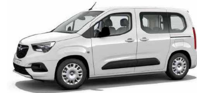
רמת גימור 5 – ENJOY/EDITION PLUS מושבים