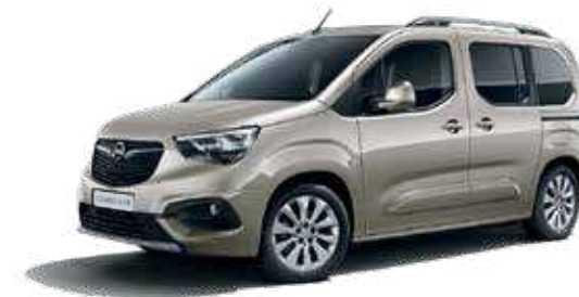
Cool Grey (GAC) בז' מטאלי*