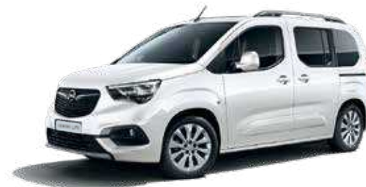
White Jade (G2O) לבן