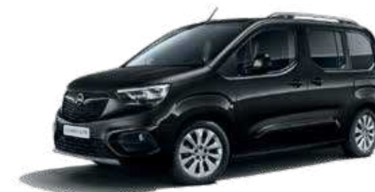
Onyx Black (G7R) שחור מטאלי*