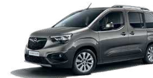
Moonstone Grey (G4O) אפור כהה מטאלי*