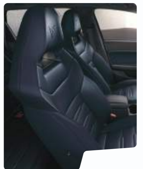
מושב באקט עור כחול