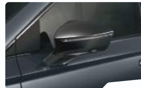
אפור מטאלי S7S7