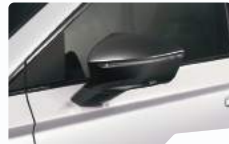
לבן נבדה 2Y2Y