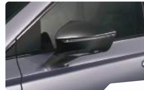
כסוף מטאלי L5L5