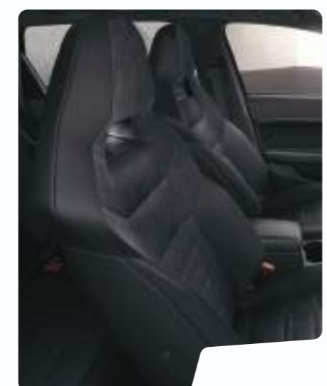
מושב באקט בד