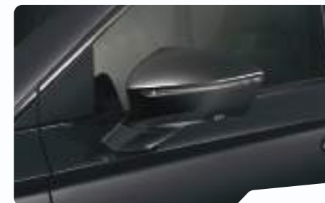
שחור פנינה 6J6J