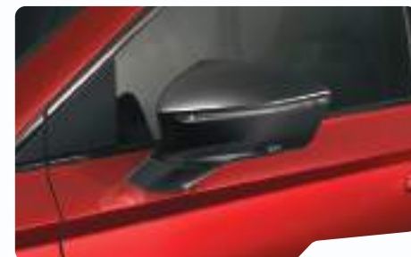
אדום כהה יין E1E1