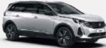
לבן פנינה מטאלי PEARLESCENT WHITE | N9M6