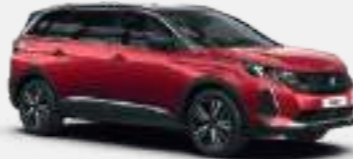
אדום מטאלי ULTIMATE RED | F3M5

*צבע מטאלי בתוספת תשלום (למעט כחול בהיר)