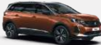
חום מטאלי METALLIC COPPER | LGM0