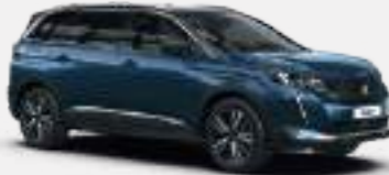
כחול בהיר מטאלי CELEBES BLUE | SYM0