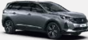
כסוף כהה מטאלי ARTENSE GREY | F4M0

לרשותך עומד מגוון רחב של צבעים שיאפשר לך להביע את עצמך באופן מלא.