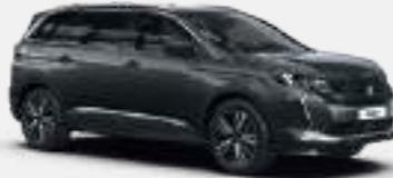
אפור כהה מטאלי PLATINIUM GREY | VLM0