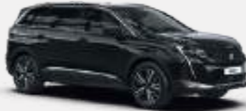
שחור מטאלי BLACK PERLA | 9VM0