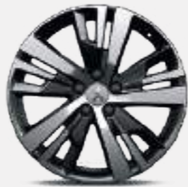
חישוקי סגסוגת 18" DETROIT

*צבע מטאלי בתוספת תשלום (למעט כחול בהיר)