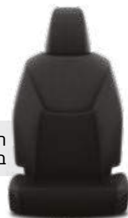
ריפודי בד בצבע שחור