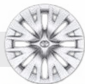
חישוקי פלדה 15"

*מומלץ לבדוק את תאימות הטלפון הנייד שברשותך למערכת ה-Bluetooth המותקנת ב-YARIS, אשר הינה מסוג: Toyota Touch 2. את הבדיקה ניתן לעשות בלינק הבא: www.toyota-tech.eu/bluetooth/search.aspx **נכון למועד פרסום קטלוג זה, אפליקציית Android Auto אינה זמינה בישראל. ***פעילות ה-E-call תלויה ברשת הסלולרית הנמצאת בקרבת הרכב בעת שידור המידע.