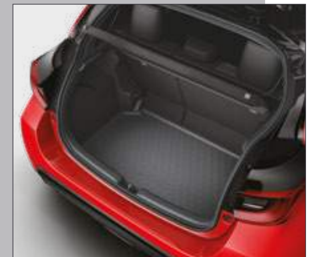
אמבטיה לתא המטען