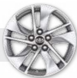
חישוקי סגסוגת קלה 15"