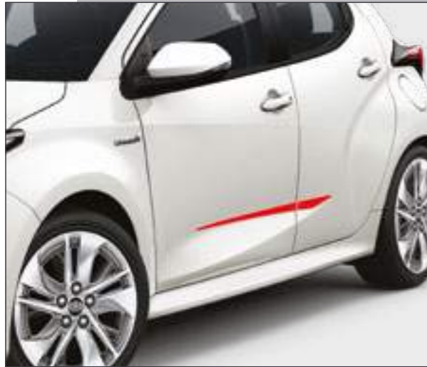
סט פסי קישוט בצבע אדום