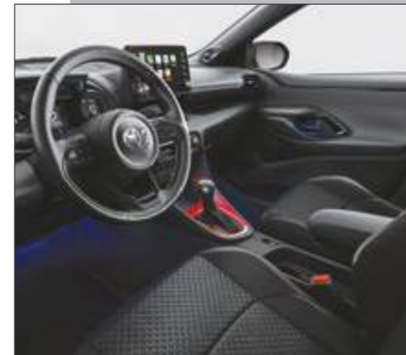
קישוט קונסולה מרכזית בצבע אדום