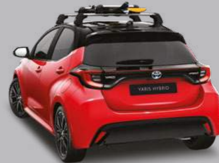
מוטות רוחב - סט של שניים