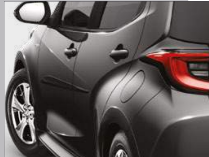
סט פסי הגנה שחורים לדלתות