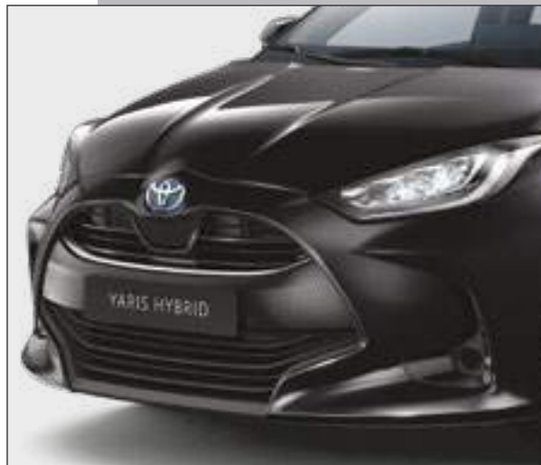
קישוט פגוש קדמי בצבע ניקל