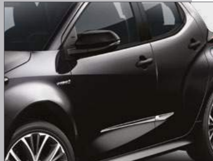
סט פסי קישוט בצבע כרום