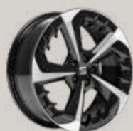
*זמין לרמת גימור FR מנוע 1.5 L בלבד

ברוכים הבאים לרמת גימור שהיא סטנדרט בפני עצמה. מהמושבים המעוצבים, דרך חלון הגג הפנורמי ועד המראה הספורטיבי ומערכות הבטיחות המתקדמות - כל פרט ופרט נוצר ועוצב כדי לטפק לכם חוויית נהיגה משודרגת.