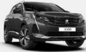
אפור כהה מטאלי PLATINIUM GREY | VLM0