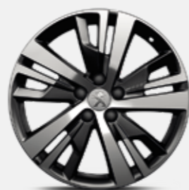
חישוקי סגסוגת 18" ACTIVE PACK בדגמי PREMIUM-I