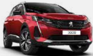
אדום מטאלי ULTIMATE RED | F3M5