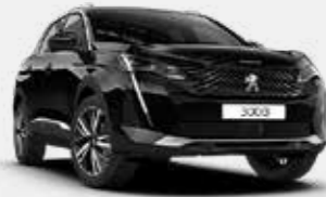
שחור מטאלי BLACK PERLA | 9VM0

לרשותך עומד מגוון רחב של צבעים שיאפשר לך להביע את עצמך באופן מלא.