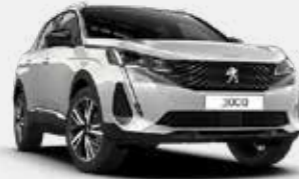
לבן פנינה מטאלי PEARLESCENT WHITE | N9M6