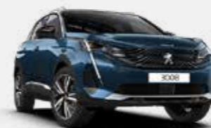
כחול בהיר מטאלי CELEBES BLUE | SYM0