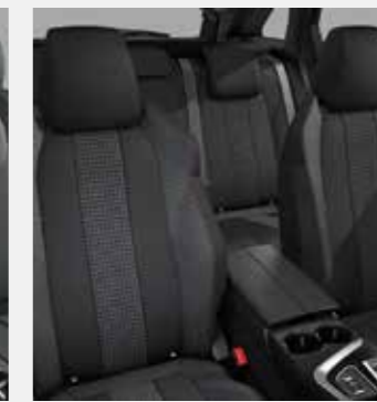
ACTIVE PACK ריפוד פנימי וגימור דלתות בצבע אפור כהה