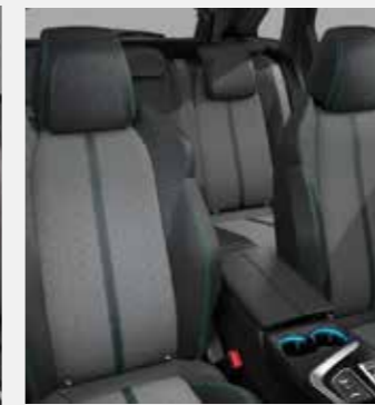
PREMIUM ריפוד פנימי וגימור דלתות בצבע אפור בהיר