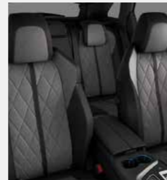
GT מושבים בריפוד עור מלאכותי משולב אלקנטרה