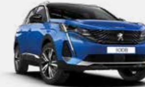
כחול פנינה מטאלי VERTIGO BLUE | SMM6

*צבע מטאלי בתוספת תשלום (למעט כחול בהיר)