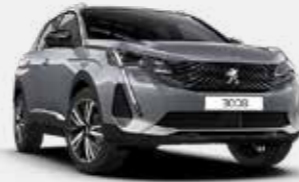
כסוף כהה מטאלי ARTENSE GREY | F4M0