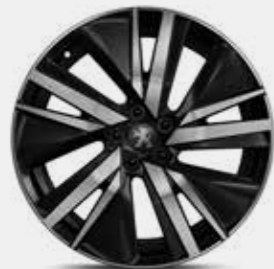
חישוקי סגסוגת 19" San Francisco בדגמי GT

*צבע מטאלי בתוספת תשלום (למעט כחול בהיר)