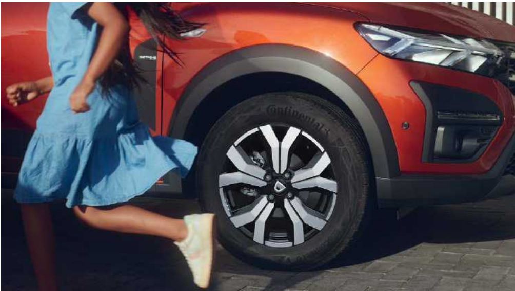
חישוקי סגסוגת חדשים

עם מרווח גחון גבוה, קשתות גלגלים מודגשות וקורות מודולריות על הגג, Jogger החדש מתאפיין בעיצוב קשוח שכובש כל דרך, והופך אותו לרכב אידיאלי למשפחות בעלות אורח חיים דינמי. הייעוד של ה-Jogger הוא להיות שותף מתמיד לחיי היומיום של משפחות המעוניינות לבלות מחוץ לעיר ובחיק הטבע. תוכלו לקחת את כל המשפחה לטיולים ואם תרצו, צרפו גם את החברים של הילדים.