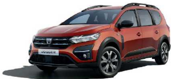
חום אדמה מטאלי (CNZ)