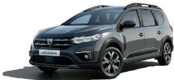
אפור מטאלי (KNA)