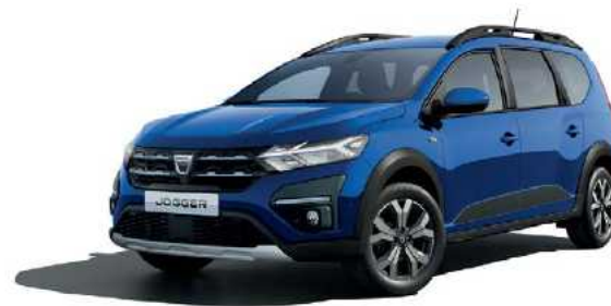
כחול בהיר מטאלי (RQH)