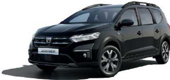
שחור פנינה מטאלי (676)