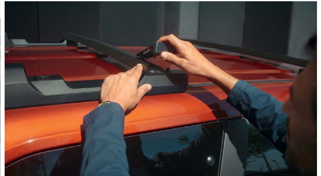
קורות גג מודולריות