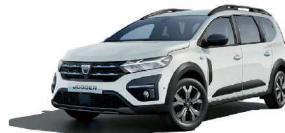
לבן קרח (369)