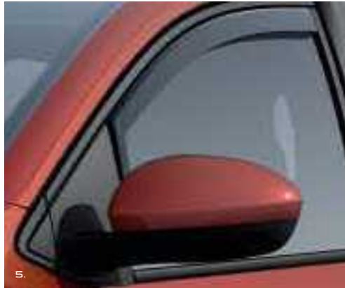
5. מסיטי רוח