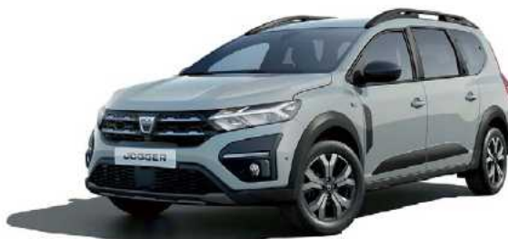
כסף מטאלי (KQF)