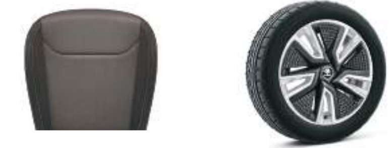
רפוד שחור-אפור - NL