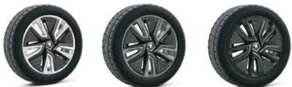
חישוק סגסוגת 17"