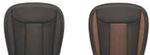
רפוד שחור - MF