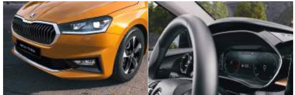
פנסי LED קדמיים

חישוקי סגסוגת 17" PROCYON AERO הגה דו חישורי בציפוי עור עם כפתורי שליטה על מערכת המולטימדיה ומנופי העברת הילוכים אופציה לחבילה Color Concept (בתוספת תשלום)*