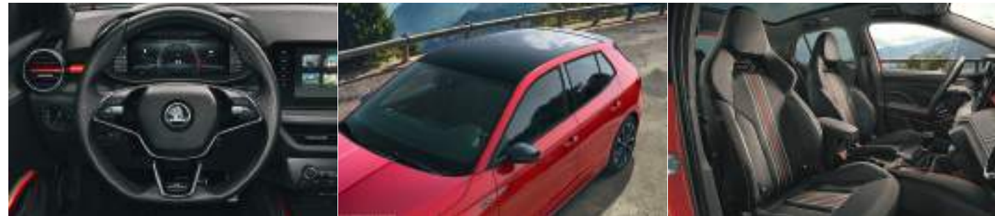
הגה ספורט קטום