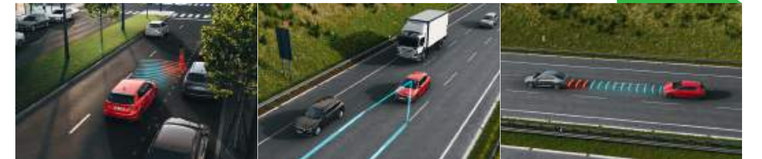
מערכת Front Assist מסייעת בניטור מרחק מלפנים

מערכת Hill Hold Control לסייע בעת זינוק בעלייה מערכת Front Assist מסייעת בניטור מרחק מלפנים אשר בולמת את הרכב בעת זיהוי סכנת התנגשות, כולל זיהוי הולכי רגל מערכת Lane Assist המפעילה תיקוני היגוי על מנת לסייע במניעת סטייה לא מכוונת מנתיב הנסיעה (המערכת פעילה רק בעת זיהוי סימני דרך) מערכת בקרת שיטת אדפטיבית Adaptive Cruise Control 9 כריזת אוויר חיישני חגורת מלפנים ומאחור מערכת לאיתור עייפות נהג חיישני חנייה אחוריים סייע תאורה בעת פתיחת הרכב ודימום מנוע (COMING HOME / LEAVING HOME / TUNNEL LIGHT / DAY LIGHT) מערכת TPMS לניטור לחץ אוויר בצמיגים מערכת Maneuver Assist המזהה מכשולים מאחורי הרכב ומסייעת בבלימת הרכב בעת זיהוי סכנת התנגשות