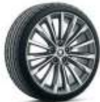
רמת גימור L&K 19"