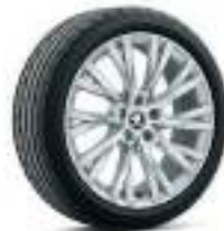
רמת גימור Style 18"