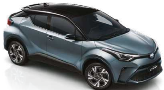
אפור תכלת / שחור 2TH - 202/1K3