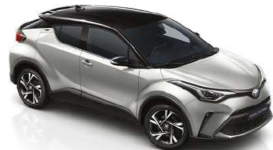
כסוף מטאלי / שחור 2VU - 202/1L0