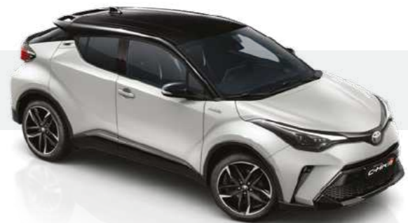
לבן דינמי / שחור 2VF - 202/1K6