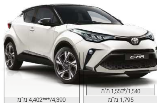
מ"מ 4,402***/4,390 מ"מ 1,550*/1,540 מ"מ 1,795

*מתייחס לדגם C-ITY. **מתייחס לדגם C-HIC. ***מתייחס לדגם GR SPORT