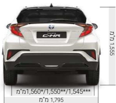
מ"מ 1,560*/1,550**/1,545*** מ"מ 1,795