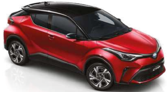
אדום עז / שחור 2TB - 202/3U5