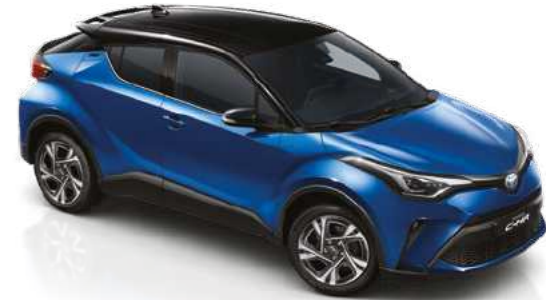
נחול פיג'י / שחור 2NH - 202/8X2