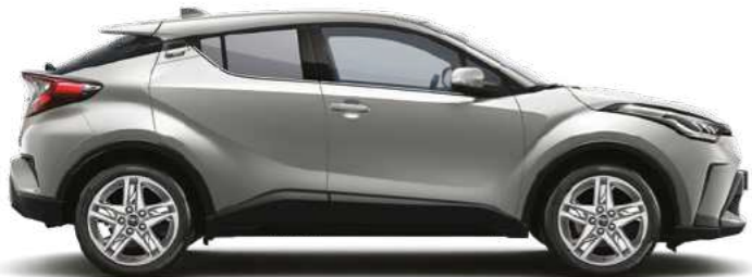
כסוף מטאלי 1L0