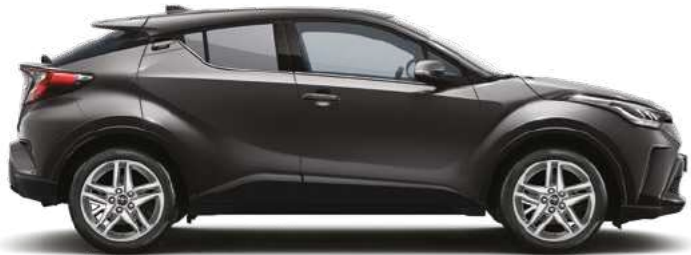
אפור גרניט מטאלי 1G3