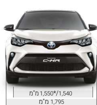
מ"מ 1,550*/1,540 מ"מ 1,795