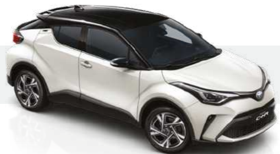
לבן פנינה / שחור 2VP - 202/089