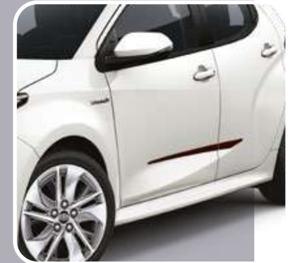
סט פסי הגנה שחורים לדלתות