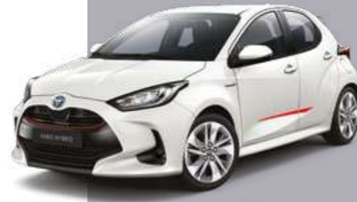
סט פסי קישוט בצבע אדום