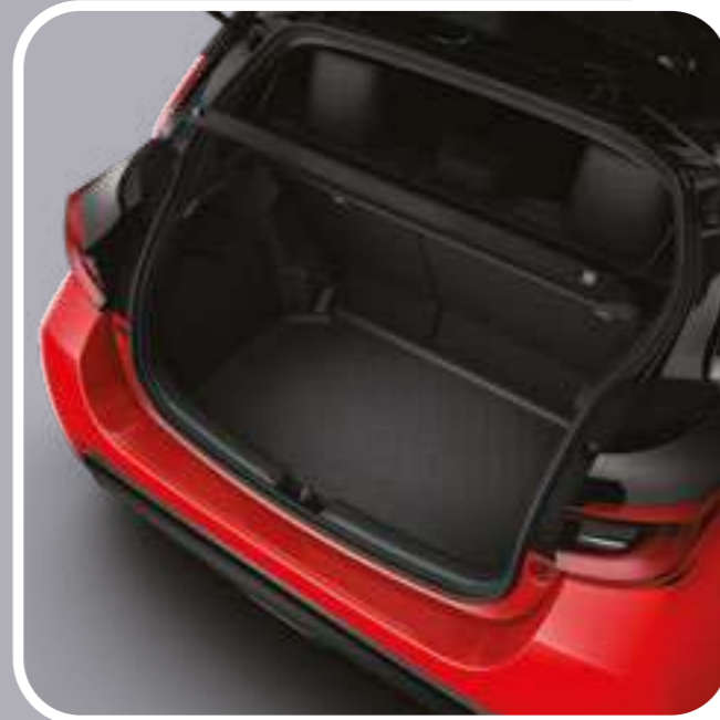
אמבטיה לתא המטען