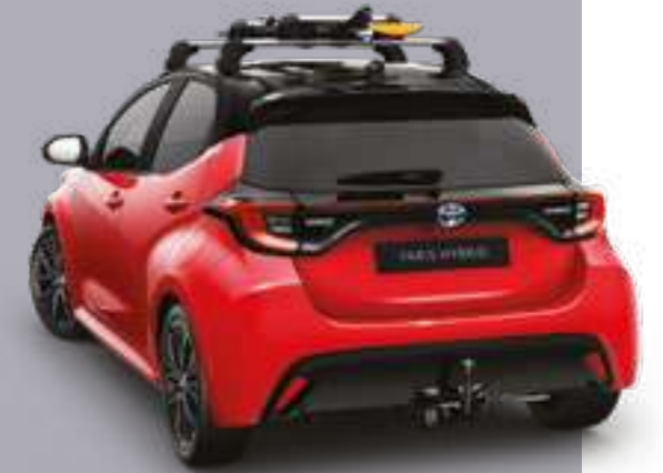
מוטות רוחב - סט של שניים