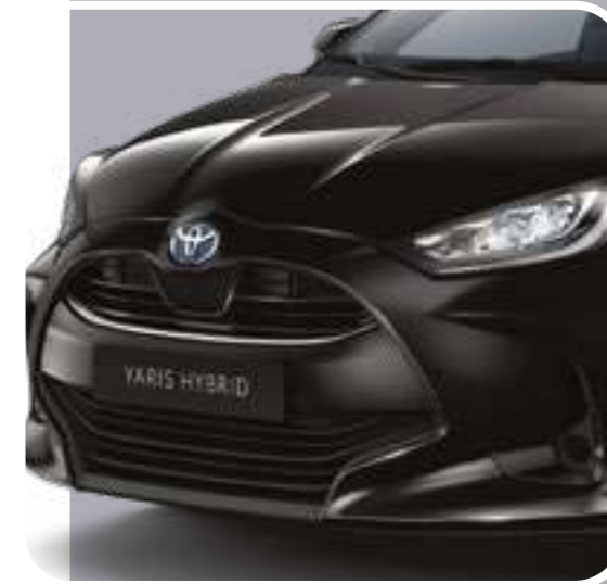
קישוט פגוש קדמי בצבע ניקל