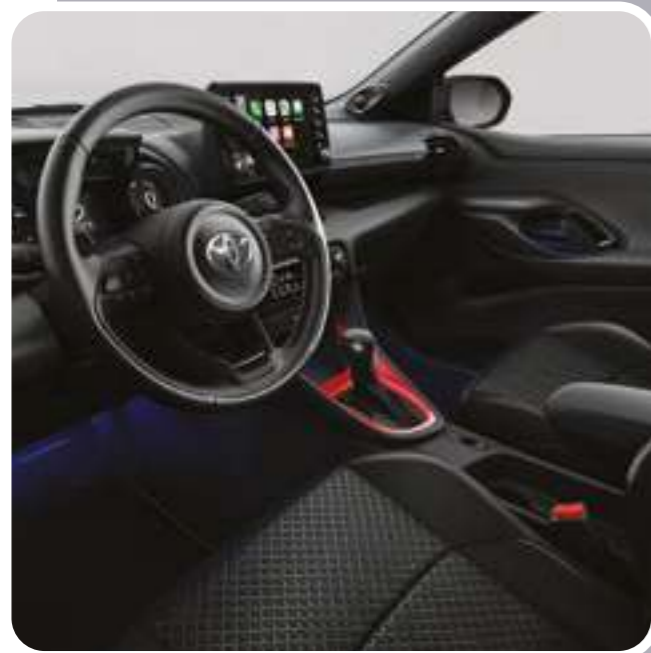
קישוט קונסולה מרכזית בצבע אדום