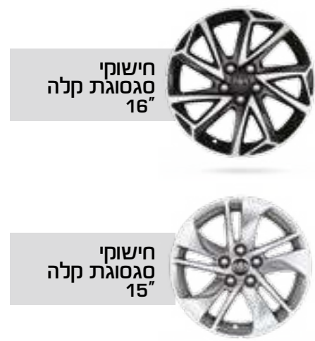
חישוקי סגסוגת קלה 16"