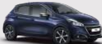
כחול אנקר מטאלי | KUM0