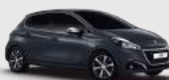
אפור הוריקן | 9GP0