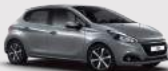
אפור ארטנס מטאלי | F4M0