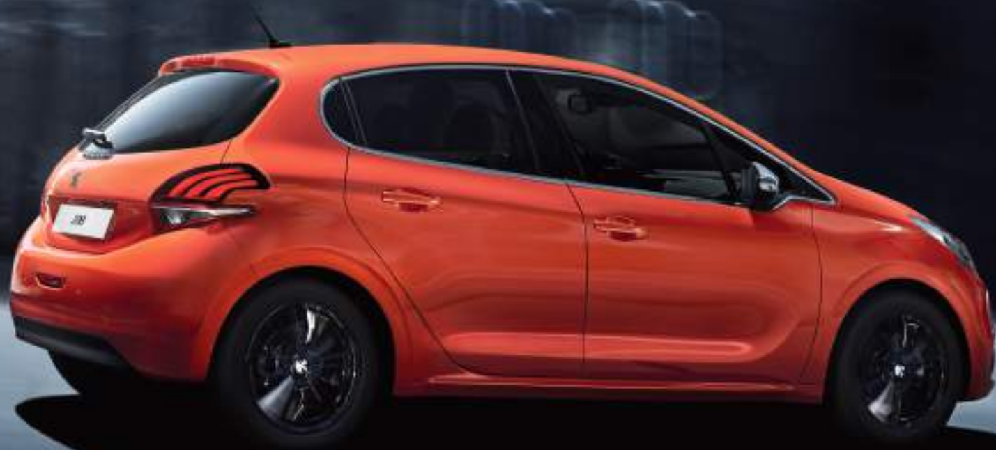
תמונה להמחשה בלבד