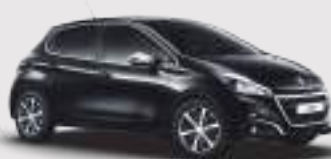
שחור פרלה מטאלי | 9VM0