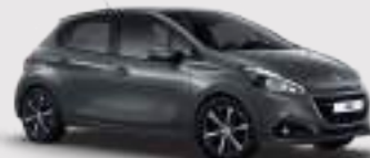
אפור פלטיניום מטאלי | VLM0