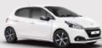
לבן בנקיז | WPP0