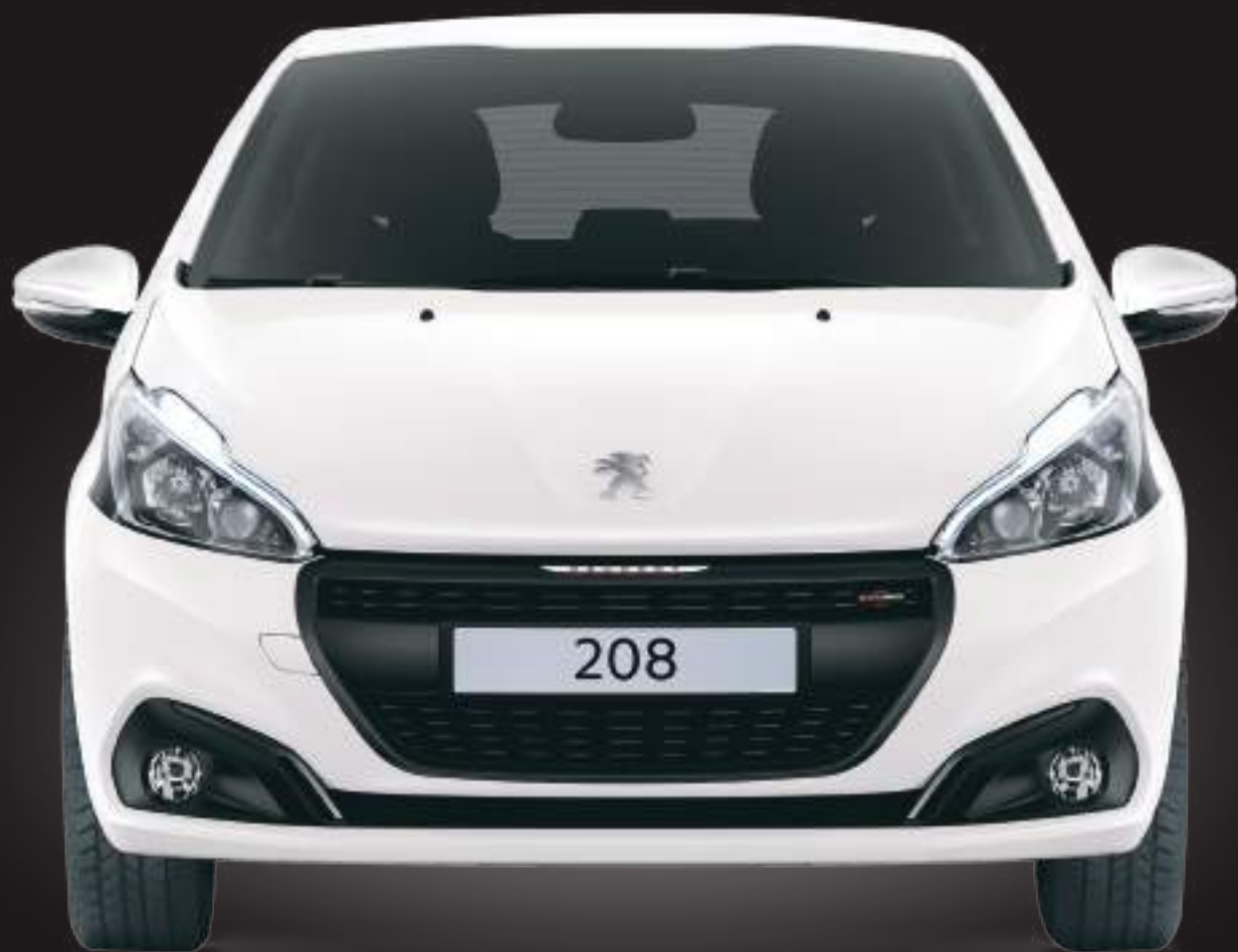
תמונה להמחשה בלבד