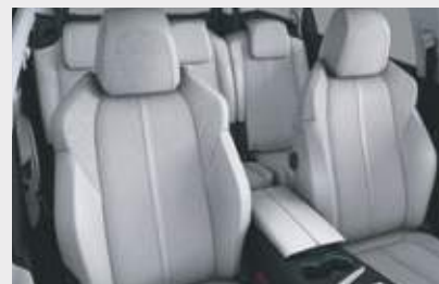
ריפוד פנימי וגימור דלתות בצבע אפור בהיר