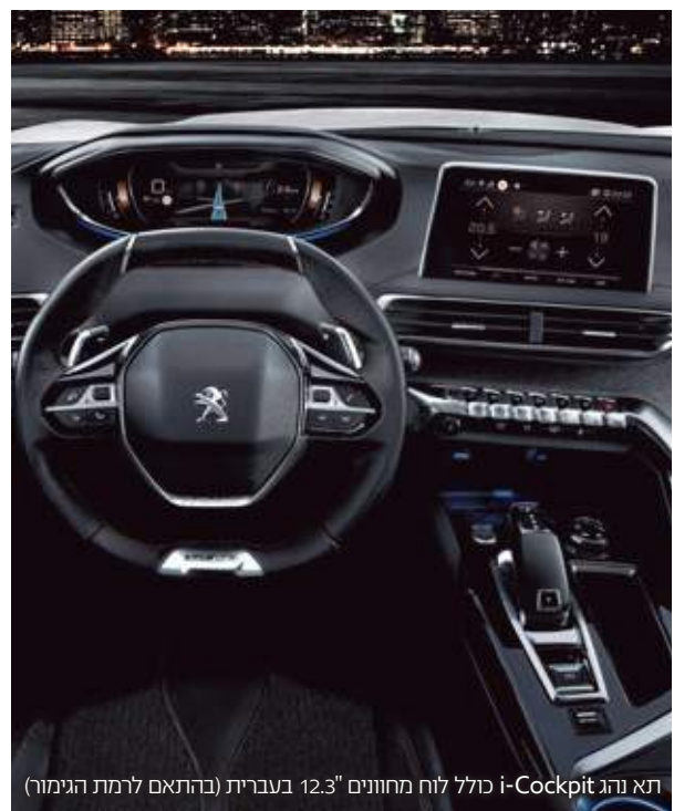
תא נהג i-Cockpit כולל לוח מחוונים 12.3" בעברית (בהתאם לרמת הגימור)