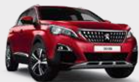
ULTIMATE RED | אדום כהה מטאלי F3M5