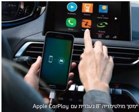
*מסך מולטימדיה 8" בעברית עם Apple CarPlay