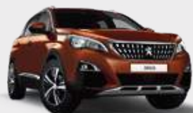
METALLIC COPPER | חום מטאלי LGM0