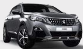
ARTENSE GREY | כסוף כהה מטאלי F4M0