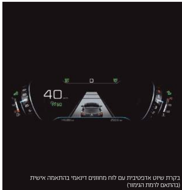
בקרת שיוט אדפטיבית עם לוח מחוונים דינאמי בהתאמה אישית (בהתאם לרמת הגימור)