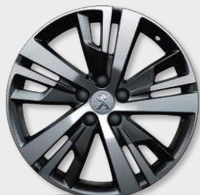
חישוק סגסוגת "DETROIT 18" סטנדרט לדגמי ACTIVE ולדגמי 1.2 PREMIUM ל'