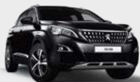
PERLA NERA BLACK | שחור מטאלי 9VM0