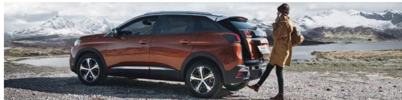
פתיחת וסגירת תא המטען באופן חשמלי באמצעות חיישן המזהה תנועת רגל מתחת לפגוש האחורי (בהתאם לרמת הגימור)