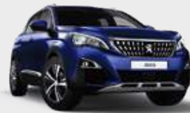
MAGNETIC BLUE | כחול ים מטאלי EGM0