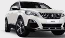
WHITE PEARLESCENT | לבן פנינה מטאלי M6N9