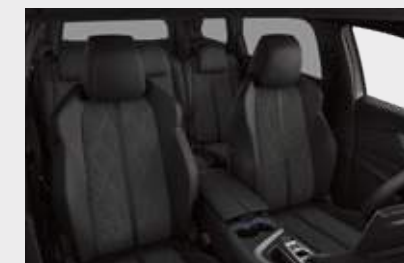
מושב בריפוד עור מלאכותי משולב אלקנטרה