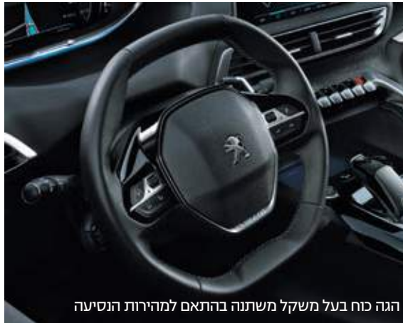
הגה כוח בעל משקל משתנה בהתאם למהירות הנסיעה