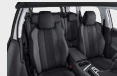
ריפוד פנימי וגימור דלתות בצבע אפור כהה