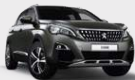
AMAZONITE GREY | אפור ירקרק מטאלי KLM0