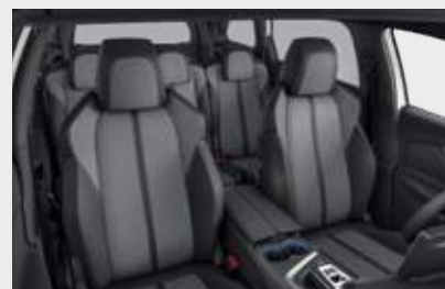
ריפוד פנימי וגימור דלתות בצבע אפור כהה