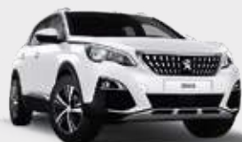
BANQUISE | לבן WPP0