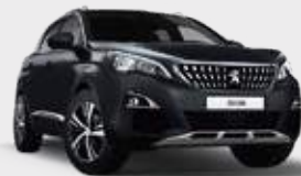
HURRICANE GREY | אפור כהה 9GP0