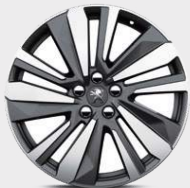
חישוק סגסוגת "WASHINGTON 19" סטנדרט לדגמי 1.5 GT/PREMIUM ו-1.6 ל' ולדגמי ה-PHEV