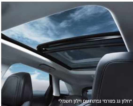
*חלון גג פנורמי נפתח עם וילון חשמלי