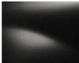
שחור פנינה מטאלי (676)