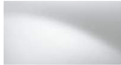
לבן קרח (369)