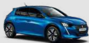
VERTIGO BLUE | SMM6 | כחול פנינה מטאלי