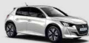
PEARLESCENT WHITE | N9M6 | לבן פנינה מטאלי