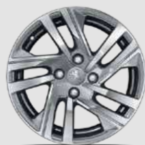
חישוקי סגסוגת TAKSIM 16" בדגמי PREMIUM S חשמליים