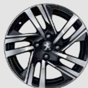
חישוקי סגסוגת SOHO 16" בדגמי PREMIUM S בנזין