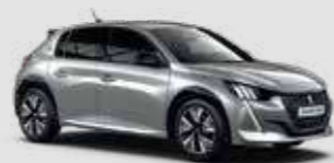
ARTENSE GREY | F4M0 | כסוף כהה מטאלי