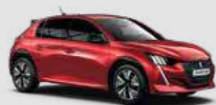
ELIXIR RED | VHM5 | אדום מטאלי