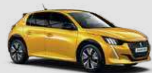
FARO YELLOW | 2TM0 | צהוב מטאלי