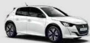
BANQUISE | WPP0 | לבן בנקיז