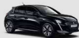
PERLA NERA BLACK | 9VM0 | שחור מטאלי