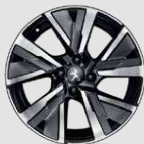
חישוקי סגסוגת CAMDEN 17" בדגמי GT Line