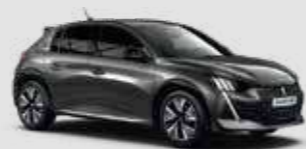
PLATINIUM GREY | VLM0 | אפור כהה מטאלי