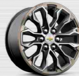
חישוק אלומיניום 17" בנימור גרפיט גוון זהוב