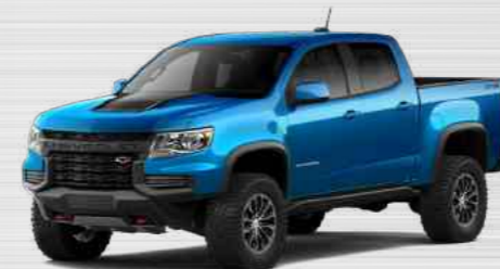
כחול לגונה מטאלי - GLT