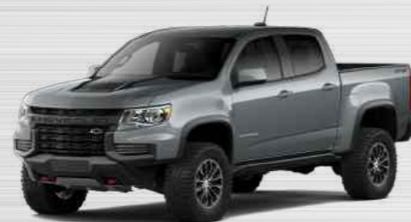
אפור פלדה מטאלי - G9K