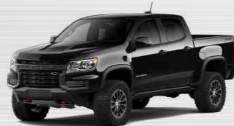
שחור - GBA