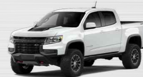
לבן פסנה - GAZ