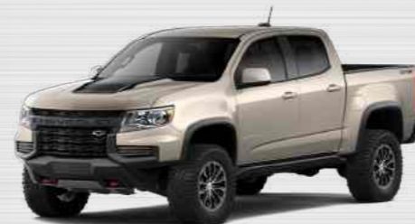
זיונה מטאלי - GTL