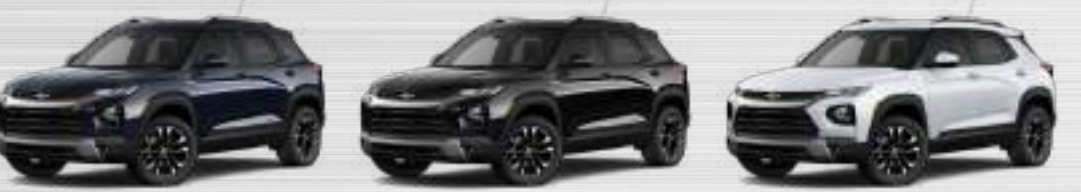
לבן פסגה (GAZ) שחור מטאלי (GBO) כחול כהה מטאלי (G5)