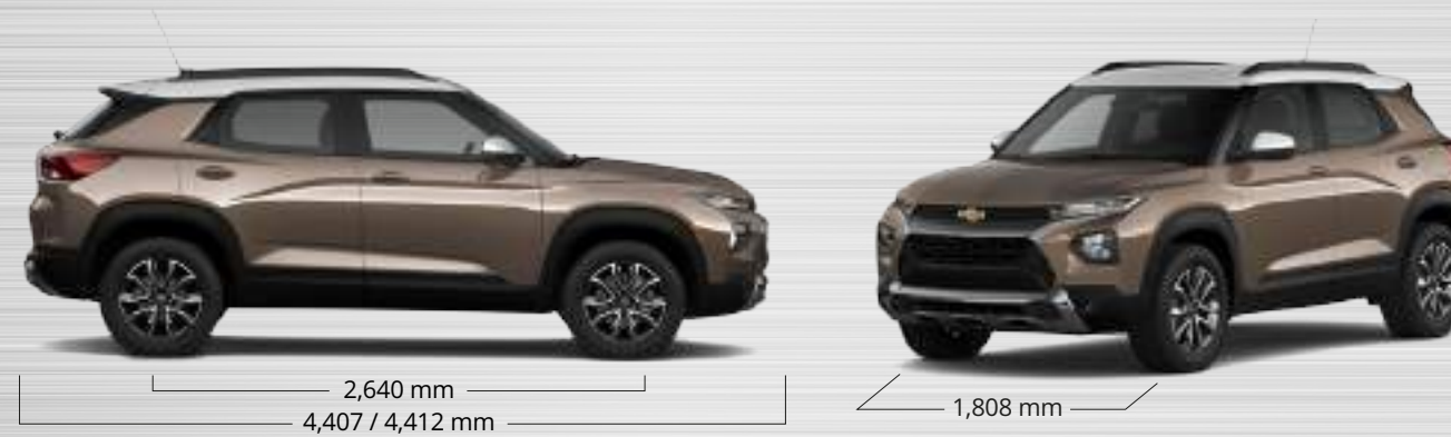
2,640 mm / 4,407 / 4,412 mm 1,656 / 1,669 mm 1,808 mm