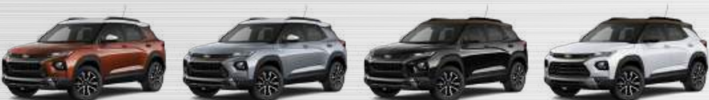
לבן פסגה (GAZ) שחור מטאלי (GBO) אפור פלדה מטאלי (GYM) חום נחושת מטאלי (G8I)