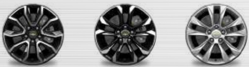
LS (17") LT+ / LTZ (17") ACTIV Z (17")